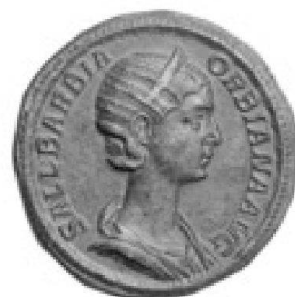
Salustia Barbia Orsiana, sœur de bronze

TRADART GENEVE SA 1, rue du Perron - 1204 Genève Tel +41 22 817 37 47 - Fax +41 22 817 37 48 e-mail : numismatique@tradart.ch site : www.tradart.ch