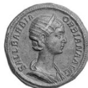
Sallustia Barbina Orbiana, sestercer de bronze

TRADART GENEVE SA 1, rue du Perron - 1204 Genève Tel +41 22 817 37 47 - Fax +41 22 817 37 48 e-mail : numismatique@tradart.ch site : www.tradart.ch