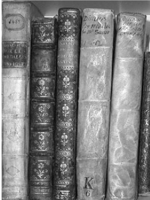
Fig. 2: Cinq exemplaires en diverses reliures anciennes.

et Savot était un homme de grande érudition» 20 , et Labbé qualifiait l'ouvrage de «travail érudit». De façon assez étonnante, la correspondance du peintre Rubens, grand amateur et épistolier fécond, ne conserve aucune lettre de ni à Savot, et ce dernier n'est pas non plus évoqué 21 . En effet, l'ouvrage de Savot ne semble pas avoir été un grand sujet de discussion ou de correspondance, pas même dans les milieux érudits et numismates: ainsi Peiresc semble n'en avoir parlé dans sa correspondance qu'avec les frères Dupuy, qui le lui avaient envoyé.