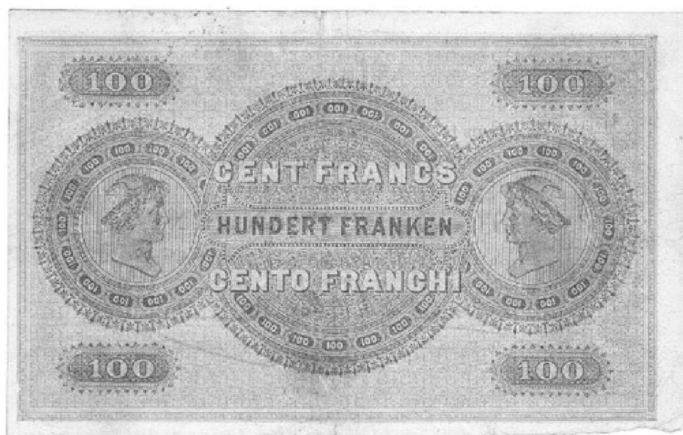
Abb. 2: Bank in Zürich, 100 Fr. vom 1. Juli 1883 (Format 183 x 116 mm).