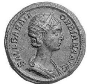
Sallustia Barbina Orbiana, sesterce de bronze