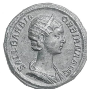
Sallustia Barbia Orbiana, sesterce de bronze