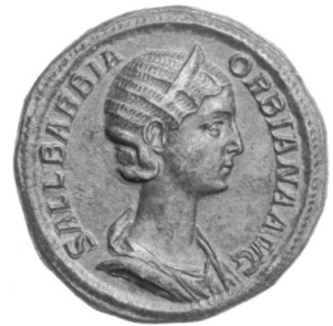
Sallustia Barbia Orbiana, sesterce de bronze