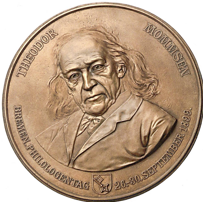
Abb. 3: Medaille auf Theodor Mommsen aus Anlass des Philologentages 1899, von Hans Bulling. Dm. 19,9 cm.; Tüb. Inv. VI 307/16b. KRMNICEK (Hrsg.) 2017, Nr. 3.