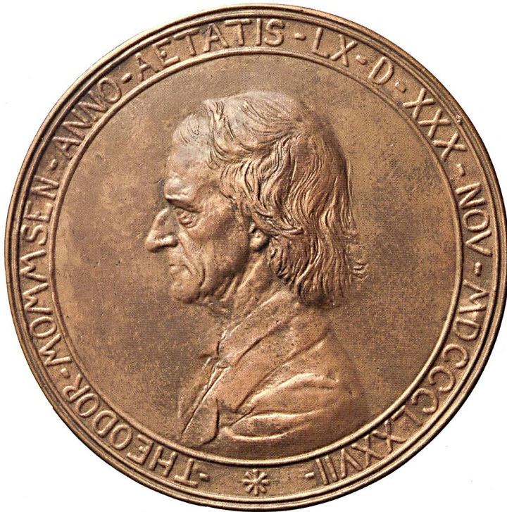
Abb. 1: Galvano der einseitigen Medaille zum 60. Geburtstag Mommsens, 1877, von Reinhold Begas. Dm. 13,4 cm; Tüb. Inv. VI 307/16a. KRMNICEK (Hrsg.) 2017 Nr. 1.