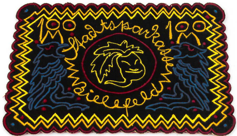
Fig. 1: Bielefeld, Ville, billet de nécessité 1921, soie 7 (14.5 x 10.05 cm, MMC 48426).