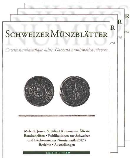
Gazette numismatique suisse