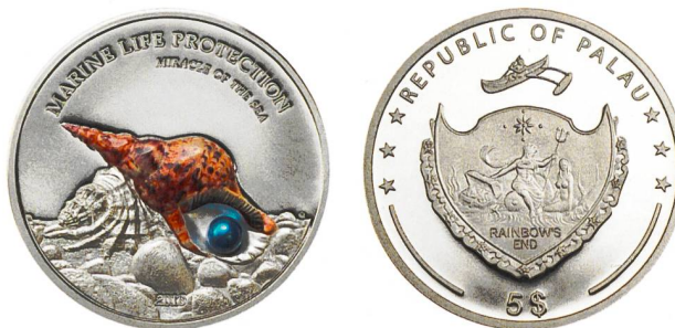
Abb. 1: Gedenkmünze aus Palau mit einem falschgewundenen Tritonshorn ( Charonia tritonis ) auf dem Revers, Ø 38,61 mm. (Photos: CIT Coin Invest AG).

Die Mollusken (Weichtiere) bilden schon seit der Antike ein sehr beliebtes Münzmotiv. Von den insgesamt acht existierenden Molluskenklassen wurden und werden die Kopffüssler (Cephalopoda), Muscheln (Bivalvia) und Schnecken (Gastropoda) auf Münzen gezeigt 2 . Bei den Schnecken und Muscheln werden allerdings fast immer nur die Schalen (Conchylien) und nicht der Weichkörper dargestellt. Der mikronesische Inselstaat Palau hat nun im Rahmen einer unter dem Motto «Marine Life Protection» laufenden Serie eine «Pearls of the Sea» betitelte Subserie von silbernen Gedenkmünzen ausgegeben, auf denen jeweils eine farbige Muschel- oder Schneckenschale 3 in Verbund mit einer echten Perle gezeigt wird 4 . Bei einer 2016 in einer Auflage von 2500 Stück emittierten Münze aus dieser Serie, die ein Tritonshorn ( Charonia tritonis ) zeigt (Abb. 1), ist jedoch aus malakologischer 5 Sicht ein Fehler unterlaufen, der in diesem kurzen Beitrag aufgezeigt und diskutiert werden soll.