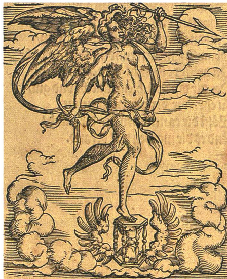
Abb. 2: Traktat von H. Lautensack (s. Abb. 1), Ausschnitt des Bildes der «Zeit» (vergrößert).

Als deren Hauptmotiv erscheint eine als «Die Zeit» ausgewiesene furios durch die Lüfte stürmende nackte geflügelte Frau. Zwar über den Wolken eilend, ist ihr rechter Fuss dennoch auf eine stabile, gleichwohl ebenfalls geflügelte Sanduhr gesetzt, wodurch die bewegte Gestalt wohl-ponderiert erscheint. Das Titelbild der «Zeit» ist zusätzlich mit der Inschrift konnotiert «Ich lauff behend / Mich niemand wend», um ihren unumkehrbaren Charakter zu betonen.