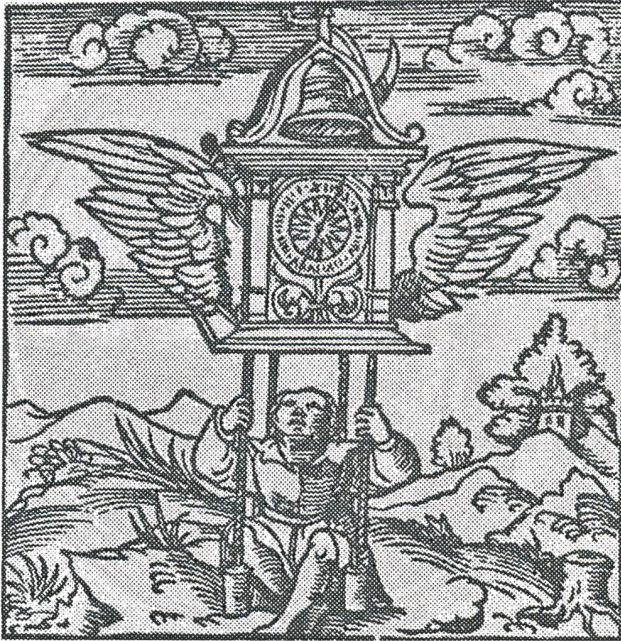
Abb. 4: Emblem «Die Zeit nutzen», Guillaume de La Perrière, Le théâtre des bons engins,... , Paris 1539 (55 × 53 mm).

B. Hinz: Jakob Stampfer, Heinrich Lautensack und die geflügelte Sanduhr, SM 70, 2020, S. 22–25.