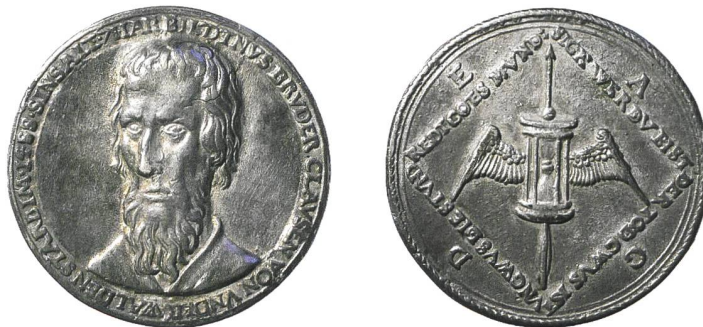
Abb. 3: Jakob Stampfer, Memorialmedaille auf Niklaus von Flüe, um 1550.

Unter Stampfers Arbeiten als Medailleur findet sich eine gegen Mitte des 16. Jahrhunderts datierbare Erinnerungsmedaille auf Niklaus von Flüe (1417–1487), Schweizer Bergbauer, Soldat, Einsiedler und Mystiker, Schutzpatron der Schweiz, kanonisiert 1947 (Abb. 3).