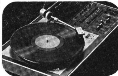
Gute Tonqualität – durch optimale Materialaufbereitung

Georg Fischer liefert die Bauteile für ein vollständiges Materialaufbereitungssystem. Dazu gehören automatisch gesteuerte Lager-, Förder-, Dosier-, Wiege- und Mischvorrichtungen. Ingenieure errechnen die Mindestleistung, die vom Materialverbrauch der Schallplattenpressen abhängt. Sie planen die Förder-systeme, bestimmen die Grösse der Lagersilos und sorgen dafür, dass die ganze Anlage auf die baulichen Gegebenheiten beim Werk abgestimmt ist.