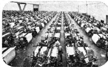
Websaal mit Schützenwebmaschinen Rütt - C1000

Geliefert werden nicht nur Werkzeugmaschinen, Textilmaschinen oder Gießereianlagen. Geliefert wird das Wissen um den Einsatz solcher Maschinen und Anlagen. Geliefert werden Analysen von Markt und Bedarf, Lösungsmöglichkeiten von Finanzfragen und Versorgungsproblemen, Einführung, Training und Ausbildung.