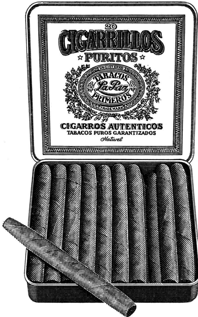
Cigarillos Puritos von La Paz in 20er-Blechk Dosen Fr. 9.-. Nur im guten Fachhandel.