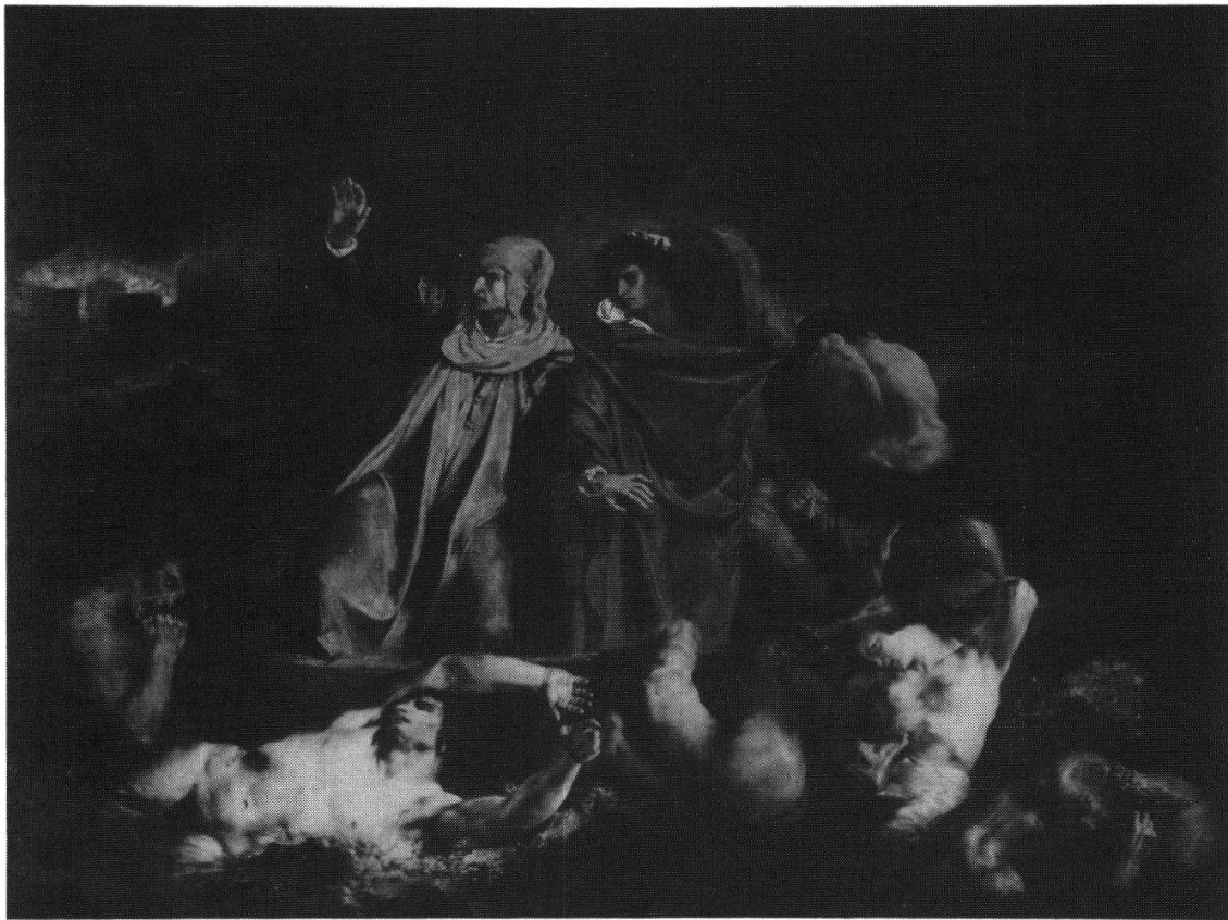
Abbildung 1: Eugène Delacroix, La Barque de Dante , 1822. Öl auf Leinwand, 189 × 241,5 cm. Musée du Louvre.

absichtlich sündiger Tat. Die Dramatik des Achten Gesanges — der literarische Stoffe der Dantearke — ist ungeheuer; erst der Neunte bringt die Lösung. Dante und Vergil geraten als Individuen in eine existenzielle Krise. Vergils Hoffnungen sinken, sein Schützling verliert den Mut weiterzugehen. Es gilt, einen Kampf zu bestehen, aber beiden fehlen die Kräfte.