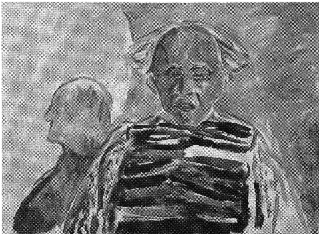
Edvard Munch: Selbstbildnis 1940/41, 57,5 × 78,5 cm. Eingefallene Augen, die Brust wie im Röntgenbild, der Haarkranz abstehend: Der alte Mann und der Tod.

ter vergeblich ihre Kinder tagelang heraus, und Hermann Schlittgen musste den Maler zuerst eine Flasche Portwein trinken lassen. Der selbst sagte zu seinem wochenlangen Schwangergehen mit einem Porträt bloss in seinem Norwegisch-Deutsch: «Ich male mit meine Gehirne».