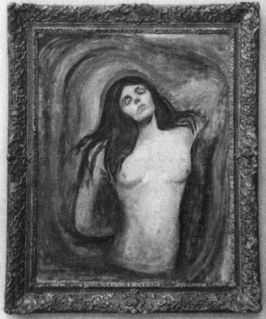
Edvard Munch (1863–1944), Madonna, um 1894, Privatbesitz, Oslo. Die Frau als erotische Macht, schön und verschlingend.

Sechzig Schaffensjahre umfasst die jetzige Ausstellung: von 1880 bis 1940. Viele Hauptwerke sind zu sehen. Das