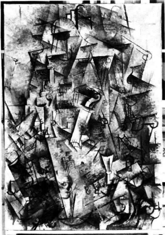
Braque: Stilleben mit Harfe und Violine . 1912, Öl auf Leinwand, Höhe 116 cm, Breite 81 cm. Kunstsammlung Nordrhein-Westfalen, Düsseldorf. 1912: Die beiden Künstlerfreunde nähern ihre Bildsprache bewusst einander an.

Faszinierender noch als die eben erwähnten Unterschiede sind die Übereinstimmungen der beiden Künstler. 1911 verbrachten Picasso und Braque gemeinsame Sommerwochen in Céret, 1912 in Sorgues. Die Experimente Schulter an Schulter sind auf dem Höhepunkt. Die Kompositionen beginnen sich derart zu ähneln, dass die Besucherin sich immer wieder am Namenschildchen vergewissern muss, mit wem sie es zu tun hat. Den Künstlern war diese Verwirrung offensichtlich willkommen. Sie beschlossen, ihre Werke nicht mehr wie bis anhin auf der Vorderseite zu signieren, sondern auf