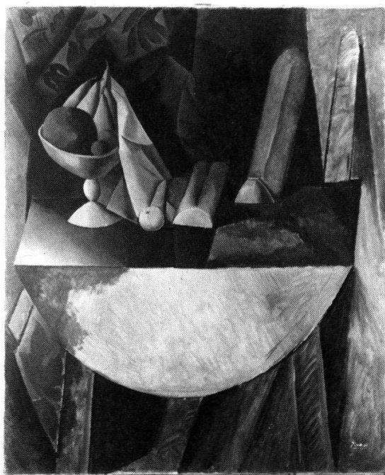
Picasso: Pain et compotier aux fruits sur une table. 1909, Öl auf Leinwand, 164 × 132,5 cm. Öffentliche Kunstsammlung Basel. Picasso, der Geschichtenerzähler, bleibt immer wieder den realen Dingen dieser Welt verhaftet.

Braque ist der erste, der Viadukt, Strasse und Baum zu kristallinen, schwerelosen Gebilden werden lässt, die Farben auf Grau- und Ockertöne zurücknimmt. So wird das Gegenständliche in die Fläche eingebunden und fast unkenntlich gemacht. Auch Picasso zerlegt das Motiv, aber er bleibt kräftiger und naturnaher in Kontur und Farbe. Brot und Krug sind bei ihm noch solide Dinge, mit dramatischer Exi-