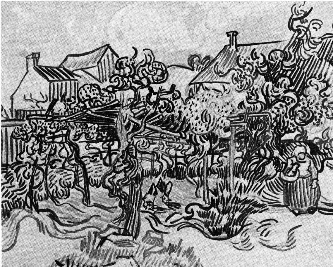
Alter Weingarten mit Bäuerin (Auvers 1890, 43,5 × 54 cm). Nicht um «Effekte» geht es van Gogh, sondern in seinen Worten um einen «strategischen Lageplan». So sicher sind denn auch die kurzen Tuschestriche gesetzt.

ausmachen. Aber hélas, da erwanderte ich Saal um Saal rein akademischer, wenn auch teils gekonnter Studien von Figuren, Gesichtern, konventionell in tonigen Schattierungen. Van Gogh möchte «gefällig» sein, erträumt sich ein Leben als Illustrator, um — immer wiederkehrendes Problem in den Briefen — Geld zu verdienen.