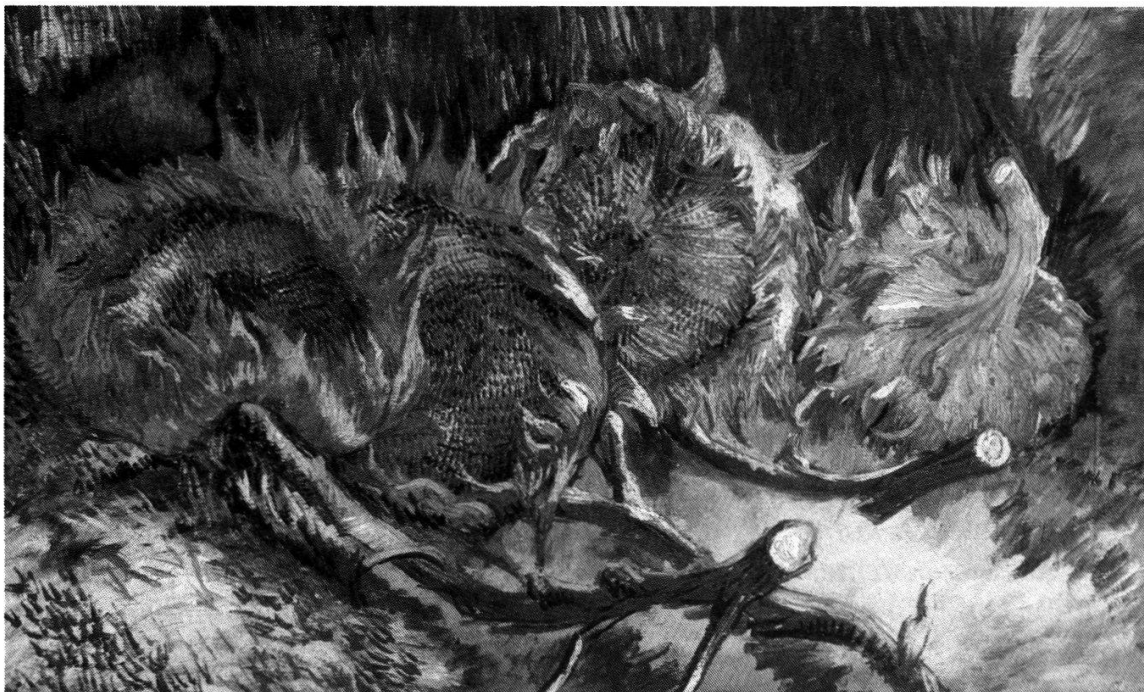
Stilleben mit vier Sonnenblumen (Juli – September 1887, 50 × 60 cm). Lauter kleine Farbteilchen bringen die schweren Köpfe der Sonnenblumen zum Drehen wie Feuerräder.

Oder sind die Porträts die Höhepunkte? Sie waren auch für den Maler eminent wichtig, nur klagte er über das Fehlen von Modellen. Ein Lebensbild ist das Bildnis des Farbhändlers Tanguy, des gütigen, den alle «Père» nannten. Er sitzt da mit schlicht gefalteten Händen, wie ein Bauer, als Erin-