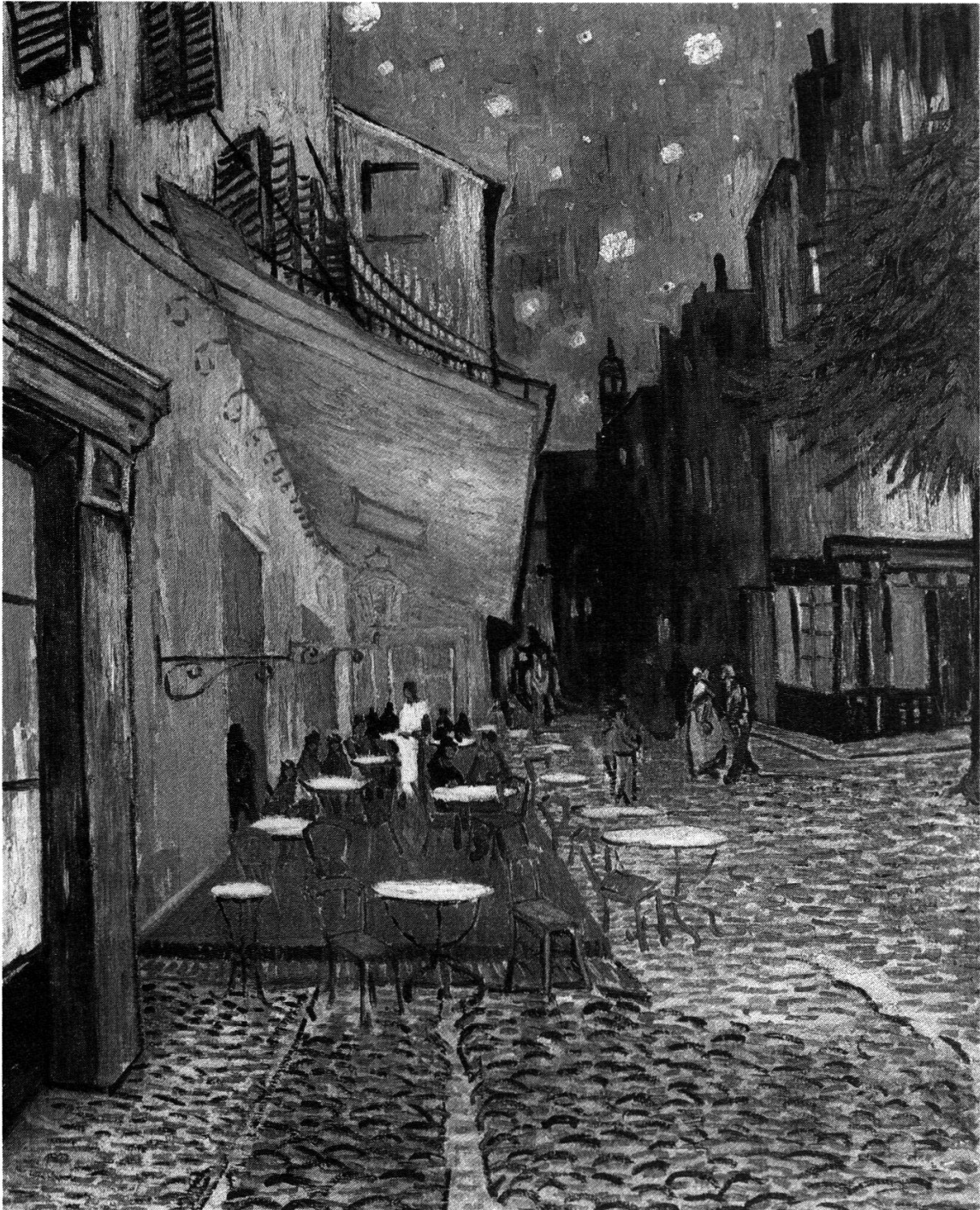
Café-Terrasse de la place du Forum (September 1888, 81 × 65 cm). In der Vorfreude auf die Ankunft von Gauguin in Arles malt van Gogh das Café Terrasse mit lichtgelber Wirtschaft und dem herrlichsten enzianblauen Himmel. Man müsste, schreibt er Theo, hier im Süden eine neue Koloristenschule gründen. Er hat sie nicht nur begonnen, sondern sogleich auch das Vollendetste beigesteuert.