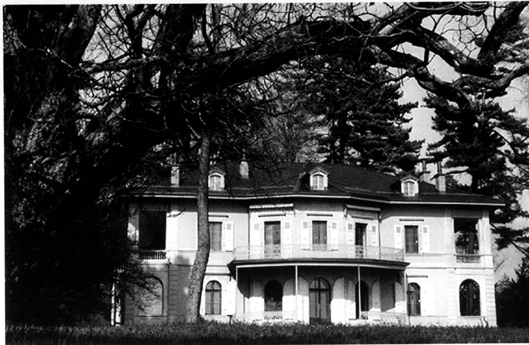
Musée und Fondation de l'Hermitage, Donation famille Bugnion in Lausanne, 2, route du Signal, Südansicht.

Haltung ist letztlich völlig legitim. Auch ich werde in der Tradition der Hermitage weiterarbeiten, grosse, bekannte Künstler auszustellen. Denn viele Menschen, vor allem junge, sehen diese zum ersten Mal. Doch zugleich möchte ich auch Kunst anbieten, die etwas zu unserem Jahrhundert gesagt hat, das immerhin in wenigen Jahren schon zu Ende gehen wird. – Das Museum, das stets viele Menschen anzieht, muss nicht unbedingt die besten Ausstellungen zeigen. Es ist zweifellos ein Paradox der Demokratisierung von Kunst, dass ein Satz weiterhin Geltung hat: je weniger Leute eine Ausstellung besuchen, desto grösser das Interesse.