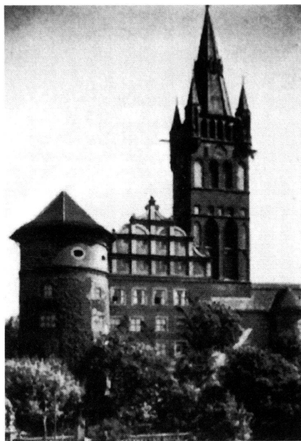
Königsberg: Schloss nach Wiederaufbau.

Die kirchliche Präsenz in der Kaliningrader Oblast begann erst mit der Perestroika. Im Jahr 1986 richtete sich die russisch-orthodoxe Gemeinde in der ehe-