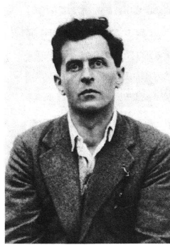
Ludwig Wittgenstein 1889–1951

1950, ein Jahr vor seinem Tode, beschäftigt sich Wittgenstein mit der erkenntnistheoretischen Frage des Innen und Aussen in der Psychologie, den Evidenzerlebnissen im Psychischen, dem Anderen, dem Seelischen und dem schon andernorts behandelten Thema Schmerz. Er zeigt auf, dass es «innere» und «äussere» Begriffe gibt. Folgende Gedankenkreise verdeutlichen das Ringen um die treffendste Beschreibung.