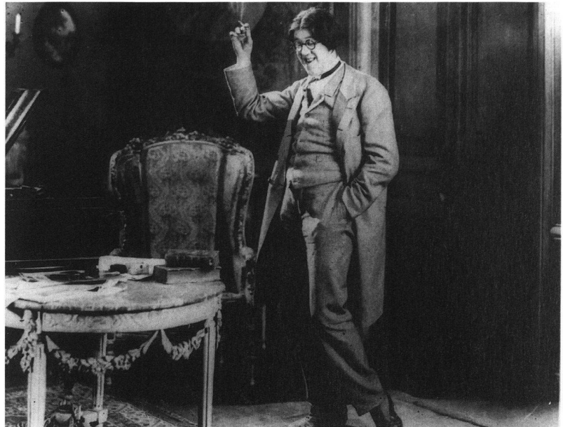
Michel Simon in seiner ersten Kinofilmrolle La vocation d'André Carrel von Jean Choux (1925).

Die Arbeit des Schweizer Filmarchivs konnte sich dank der guten Beziehungen zur Branche entwickeln. Mit der Zeit entstand die Notwendigkeit, das Material nicht mehr an verschiedenen Orten zu lagern. Dies um so mehr, als ab 1952 die Filme aus leicht brennbarem Nitrat durch solche aus feuerfestem Acetat ersetzt wurden, was u. a. andere Arten der Konservierung und andere Lagertemperaturen bedingte. Zudem wurde uns die Filmwochenschau, die dank der Unterstützung des Bundes von 1940 bis 1975 in den Kinos zu sehen war, anvertraut. Dieses Material bedingte wiederum eine andere Lagerung als die von uns gesammelten Filme. Unser besonderes Augenmerk galt seit jeher der schweizerischen Produktion; wir haben alles in Bewegung gesetzt, um die frühen Schweizer Filme aufzufinden. Diese Suche nach dem nationalen Kulturerbe ist die Arbeitsgrundlage jedes