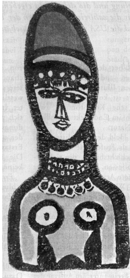
Die Islamisten mobilisieren Frauen im Stile totalitärer Parteien: Türkische Handweberei.

An solchen Widersprüchen wird die Regierung in Ankara schwer zu schaffen haben. In der arabischen Welt stösst die