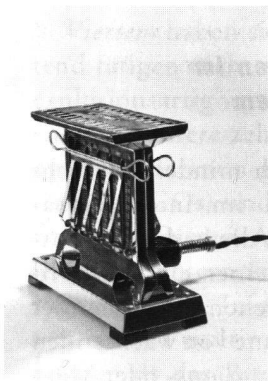
Toaster 1925, Therma AG, CH-Schwan- den, Museum für Gestaltung Zürich, Design-Sammlung, Foto: Marlen Perez.

Realismus und nicht Utopismus sind gefragt. Die europäische Integrationspolitik muss grundsätzlich auf den Prüfstand. Bevor weitere Massnahmen beschlossen werden, muss eine Reform an Haupt und Gliedern erfolgen, um das Erhaltenswerte zu retten. Die Frage muss beantwortet werden, welches die Probleme sind, die die souveränen Nationalstaaten in Kooperation nicht lösen und die somit nur von einer supranationalen Organisation bewältigt werden können. Bei ehrlichem Hinschauen dürften da nur wenige übrigbleiben. Die Behauptung, dass der Nationalstaat fast alle Probleme nicht mehr mit andern zusammen lösen könne, entspricht eher einem dogmatischen Glaubenssatz als der Realität. Dem Nationalstaat steht also noch eine blühende Zukunft bevor. ♦