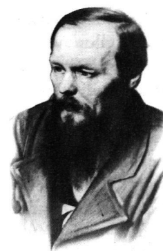
Fjodor Dostojewskij, © Athenäum Verlag.

In dem alt-russischen Epos muss Rilke erkannt haben, dass das russische Wort «znamja», («Fahne») etymologisch unmittelbar auf das Wort «znamenie» («Zeich-