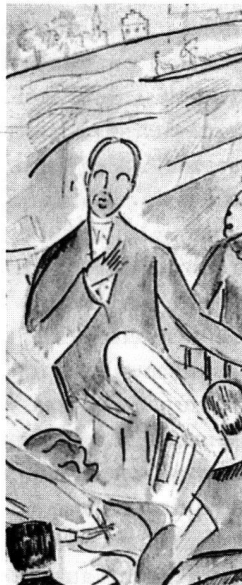
Alice Bailly: Un après-midi dans le jardin de la «Fluh» sous le charme des idées de Rilke (Ausschnitt), Insel Verlag, Frankfurt am Main.

«Die Fahnen stammeln», «Dem Fürsten zum Zeichen»: Diese Sätze, die im Original gar nicht bzw. nur in einer konventionellen Metapher stehen, drücken das semiotische wie auch metaphysische Prinzip aus, das Rilke offensichtlich «im Russischen» für