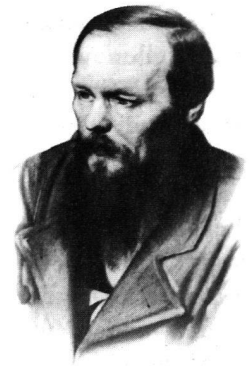
Fjodor Dostojewskij, © Athenäum Verlag.

In dem alt-russischen Epos muss Rilke erkannt haben, dass das russische Wort «znamja», («Fahne») etymologisch unmittelbar auf das Wort «znamenie» («Zeich-