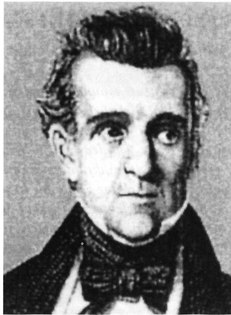
James Knox Polk