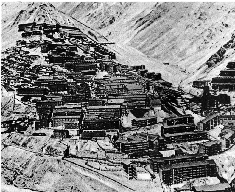
Bergbausiedlung der Sewell-Kupfermine bei Rancagua in Chile.

Dem Arbeitnehmer steht es frei, seine Verwaltungsgesellschaft zu wechseln. Schon aus diesem Grund konkurrieren die einzelnen auf diesem Markt tätigen Unternehmen untereinander darum, wer die höchste Rendite, den besten Kundendienst