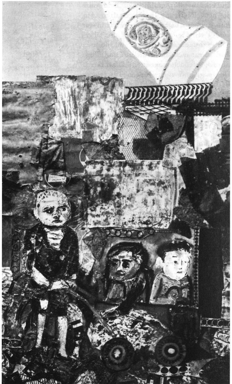
Ein Kosmonaut grüsst Juanito Laguna, von Antonio Berni. Das Symbol unseres elektronischen und spazialen Zeitalters beunruhigt das Dasein der Kinder in der Pampa in keiner Weise.

Wie von E. S. Savas hervorgehoben («The Key to Better Government», 1987), «erfordert die Einführung des Wettbewerbs eine bewusste Strategie zur Schaffung von Alternativen und zur Förderung der Akzeptanz und einer Einstellung, welche dem Bürger als Benützer öffentlicher Dienste Wahlmöglichkeiten zugesteht. Im Dienstleistungsbereich sind Optionen wesentlich». Regierungen, die versuchen, die Einkünfte zu maximieren, können interessierten Käufern Monopolrechte garantieren. Als ich 1987 Minister wurde, hatte Argentinien zwei inländische Fluggesellschaften, doch gehörten beide dem Staat. Ein Zusammenschluss war projektiert, bei dem die größere Gesellschaft (Aerolineas) die kleinere (Austral) verschlingen sollte. Ich stoppte