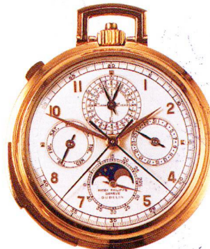
Golduhr, 18 Karat, "Grande Complication" Patek Philippe, Genève um 1931