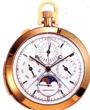
Golduhr, 18 Karat, "Grande Complication" Audemars Piguet, Genève um 1920