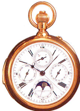
Golduhr, 18 Karat, mit ewigem Kalender A. Golay & Leriche & Fils, Genève um 1900