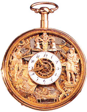
Golduhr, 18 Karat, mit erotischem Figurenautomaten, Westschweiz um 1830