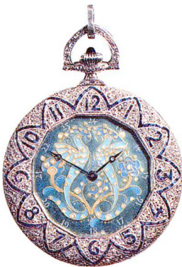
Platin-Anhängeuhr, mit Brillanten besetzt Longines, St-Imier um 1922