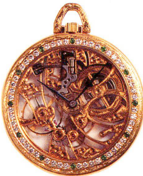
Goldene Prunk-Skelettluhr, 18 Karat Royama, Val de Joux um 1980