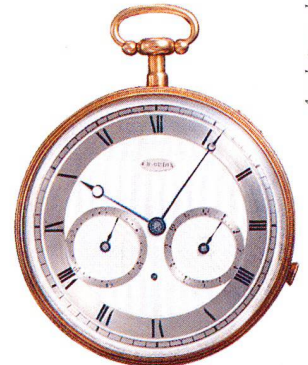
Golduhr, 18 Karat, mit Viertelrepetition und Wecker, Charles Oudin, Paris um 1810