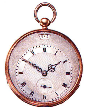
Rotgolduhr, 18 Karat Vacheron & Constantin, Genève um 1840