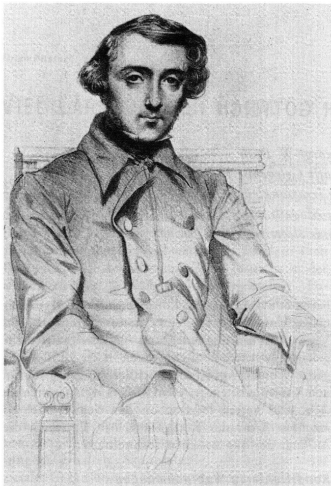
Alexis Comte de Tocqueville, nach einer Lithographie von Chasse-riau

schof, von dort aus weiter an die Pfarreien: « Escoutez doncques, loiaux François... ». Gottgewolltes wurde hier gezielt gepredigt und flächendeckend unters Volk gebracht: die unantastbare Einheit der Nation, die alles umfassende Verantwortung der Krone sowie die ewigen Prinzipien von autorité und obéissance . Ein eminent staatsdienlicher Diskurs – und die Methode sollte Schule machen. Noch im 20. Jahrhundert hat die Ecole laïque als zentralstaatlich kontrollierte, militante Geistlichkeit des republikanischen Kults jene Funktionen ausgeübt, welche der Klerus für das Ancien Régime übernommen hatte.