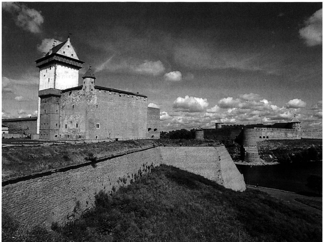
Narva, im Vordergrund die estnische Hermanns-feste und gegenüber die von Zar Ivan III. Ende des 15. Jahrhunderts angelegte russische Festung Iwangorod.