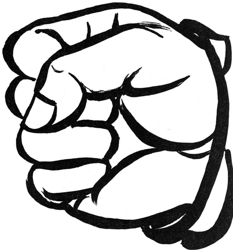
Max Hunziker, Dem seltsamen Simplicio kommt in der Welt alles seltsam vor. S. 70.

Zweitens: Die einkommensabhängige Rückzahlung. Das bedeutet etwa, dass der schon genannte Chemiker, wenn er denn in den Schuldienst geht, das, was er an Kosten verursacht hat, sicher nicht zurückzahlen wird, aber dann ist in diesem einzelnen Falle eine sinnvolle Subvention geleistet worden. Man muss dafür nicht von vornherein alle Chemiker in ihrer Ausbildung subventionieren. Man muss sich auch nicht mehr darüber aufregen, – wenn es dazu überhaupt je einen Grund gab – dass bestimmte Studierende aus Entwicklungsländern, von denen wir wünschen, dass sie als approbierte Mediziner in ihre Heimatländer zurückkehren, es vorziehen, sich in Deutschland niederzulassen. Tun sie es, dann tragen sie zur Refinanzierung dieses Hochschulsystems bei, indem sie in Deutschland Steuern zahlen. Tun sie es nicht, gehen sie zurück nach Hause, dann hat der deutsche Steuerzahler eine wirklich sinnvolle entwicklungspolitische Subvention geleistet. Aber wiederum haben wir ein sehr viel flexibleres Instrument in der Hand als bisher.