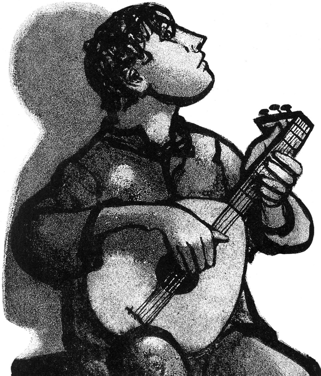
Max Hunziker, Simplissimus . «... und edel Leben geführt ...» Zürich 1945, S. 112.

Nach welchen Kriterien erfolgt die Aufnahme am FGZ, und wer entscheidet darüber?