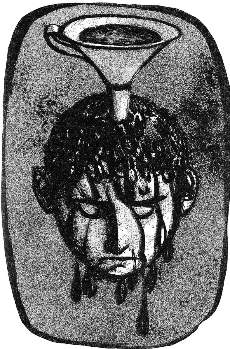
Max Hunziker, Simplissimus . Illustration zum Dritten Buch, Zürich 145, S. 161.

bände, Finanzausgleich und Zentralisierung glaubte organisieren und reglementieren zu müssen, sind in Zukunft durch Privatisierung zu lösen. Das Problem der Kosten-