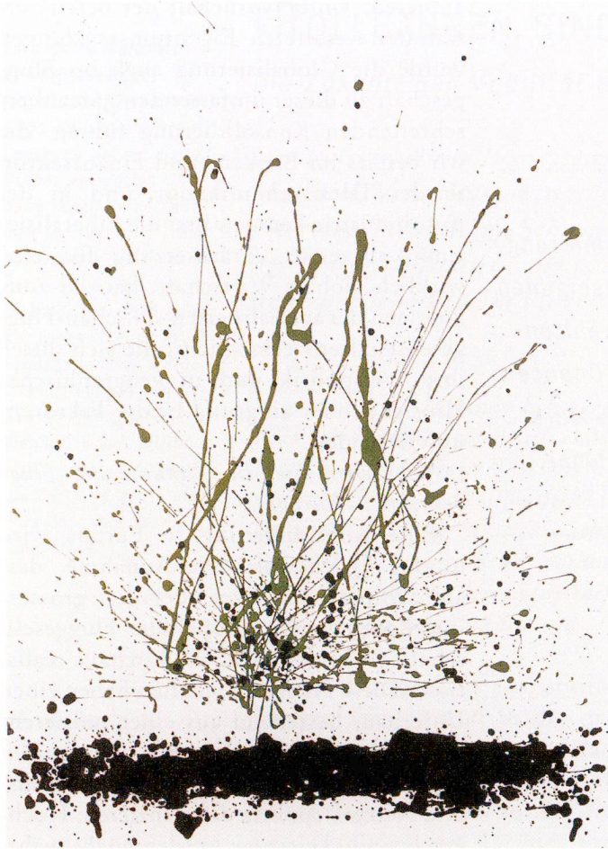
Ferruccio Soldati, Ohne Titel. Mischtechnik auf Papier, 1969, 100 x 70 cm.