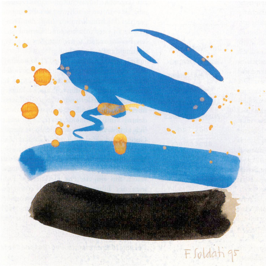
Ferruccio Soldati, Ohne Titel. Mischtechnik auf Papier, 1995, 35 x 35 cm.