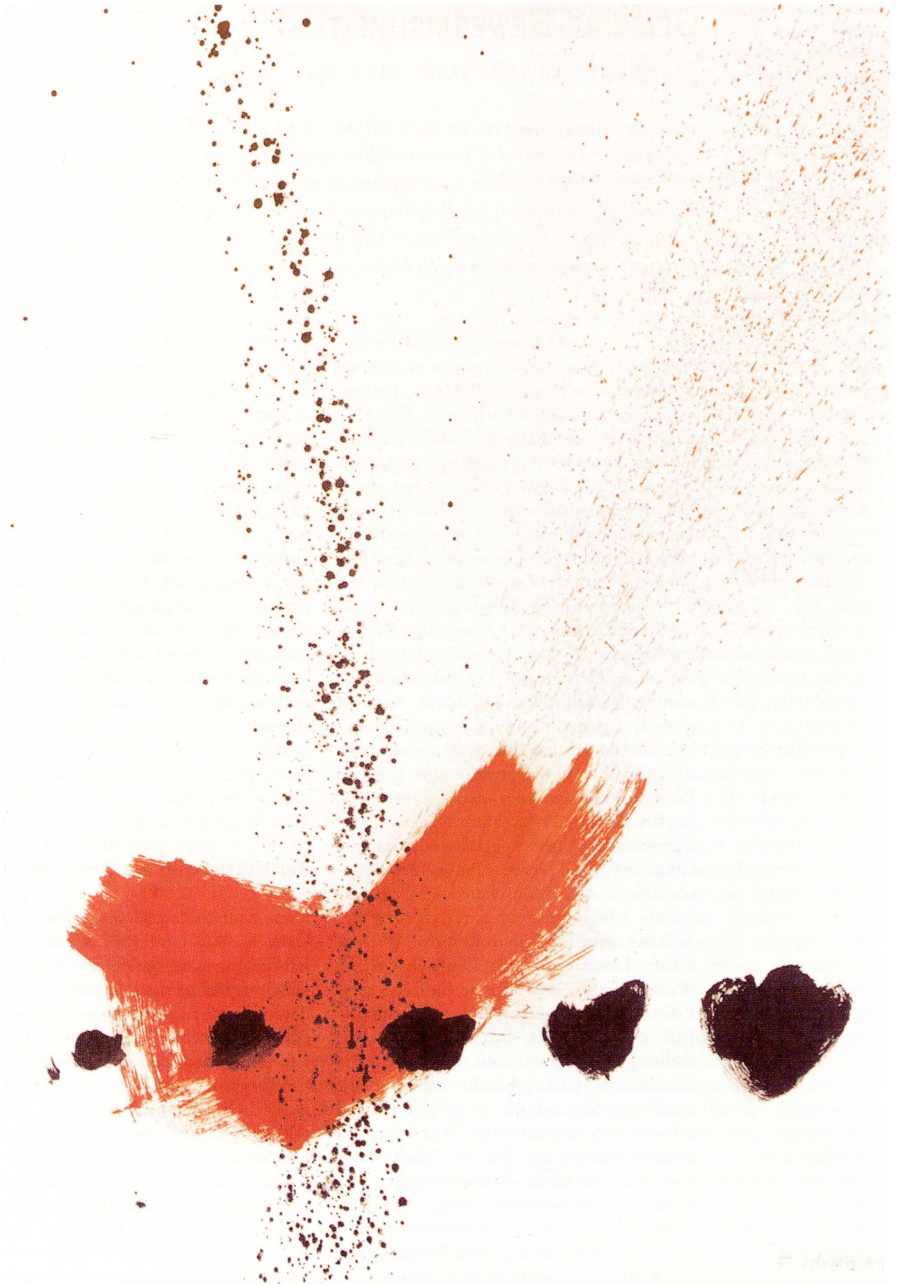
Ferruccio Soldati, Ohne Titel. Mischtechnik auf Papier, 1969, 100 x 70 cm.