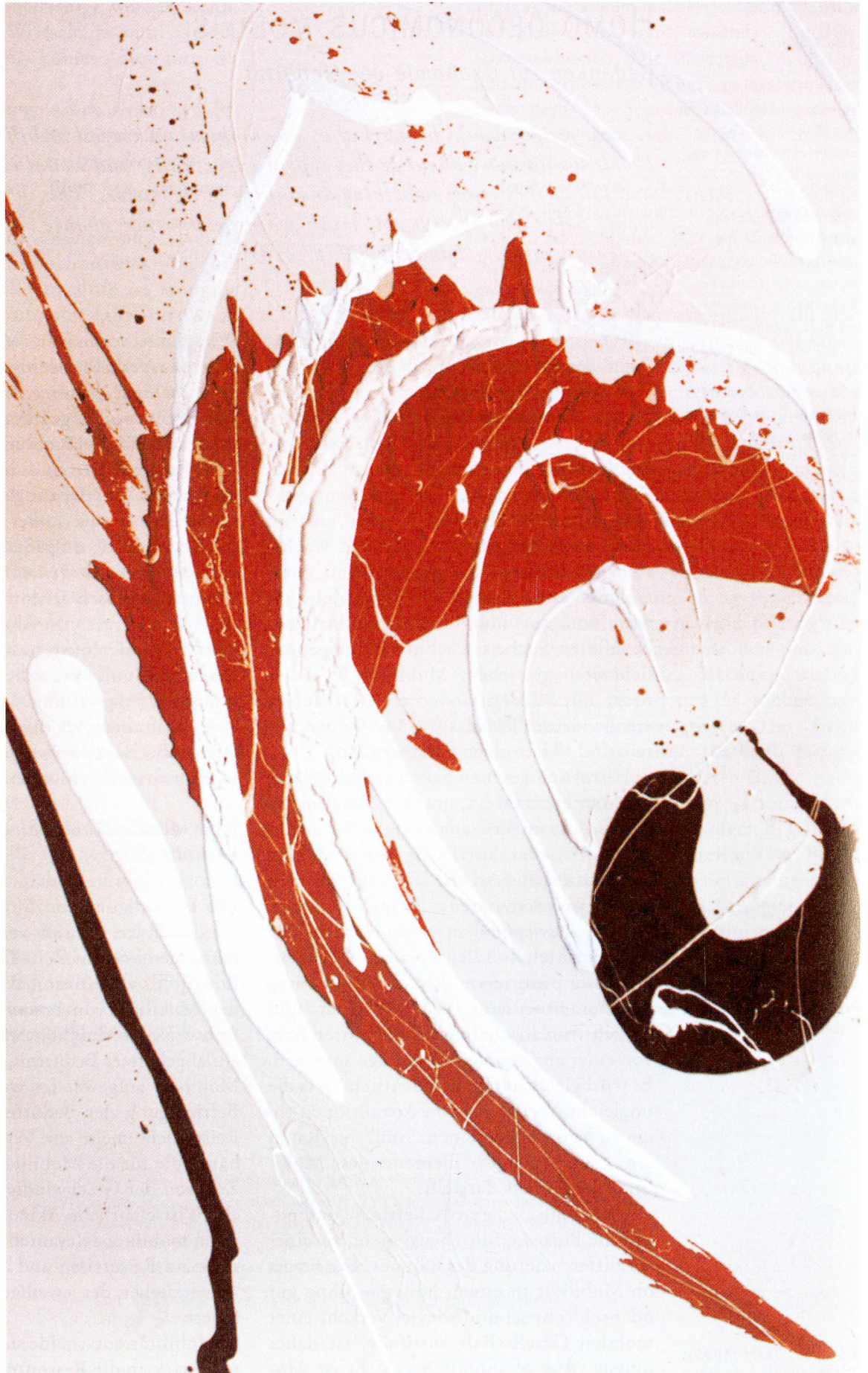
Ferruccio Soldati, Ohne Titel. Mischtechnik auf Leinwand, 1986, 165 x 110 cm.