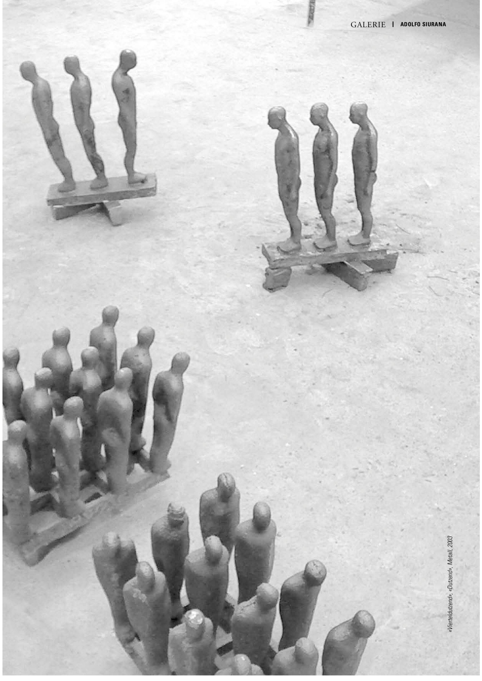
«Viertelutzend», «Dutzend», Metall, 2003