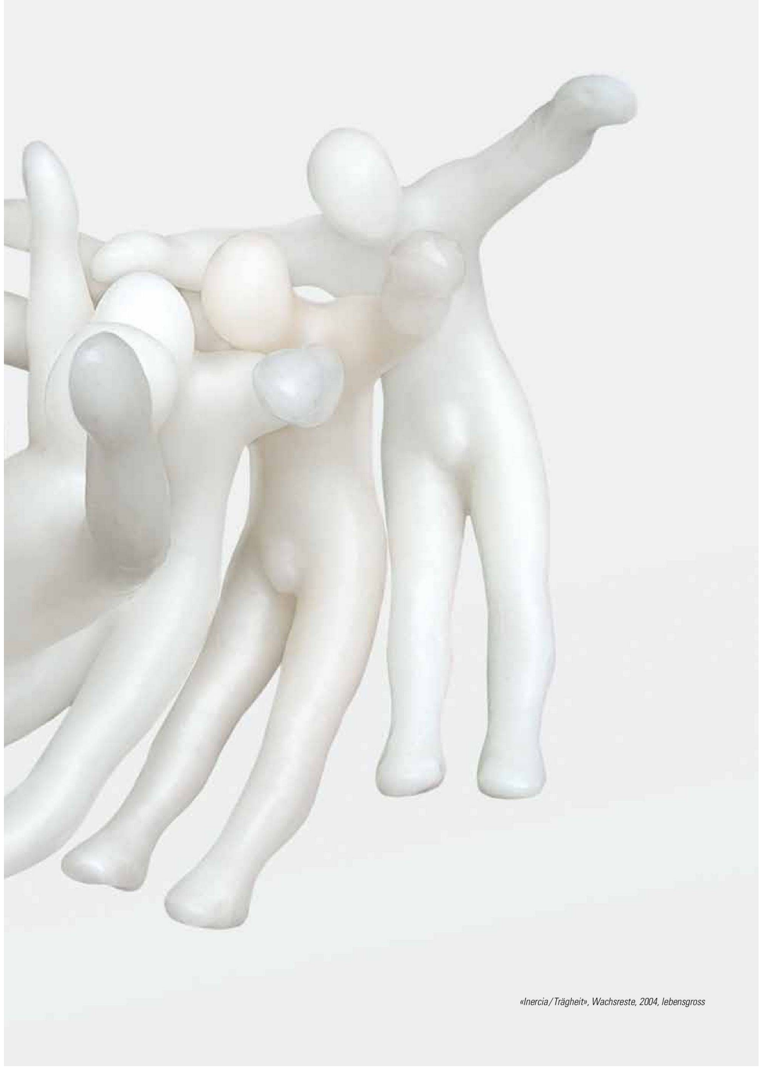
«Inercia/Trägheit», Wachsreste, 2004, lebensgross