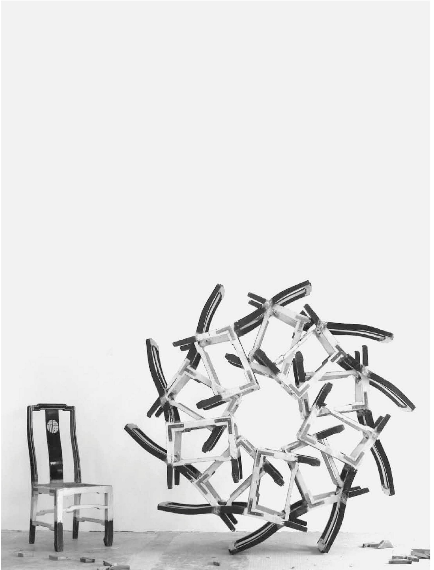
«Eleven Chairs», 789 Project Space, Beijing, 2006