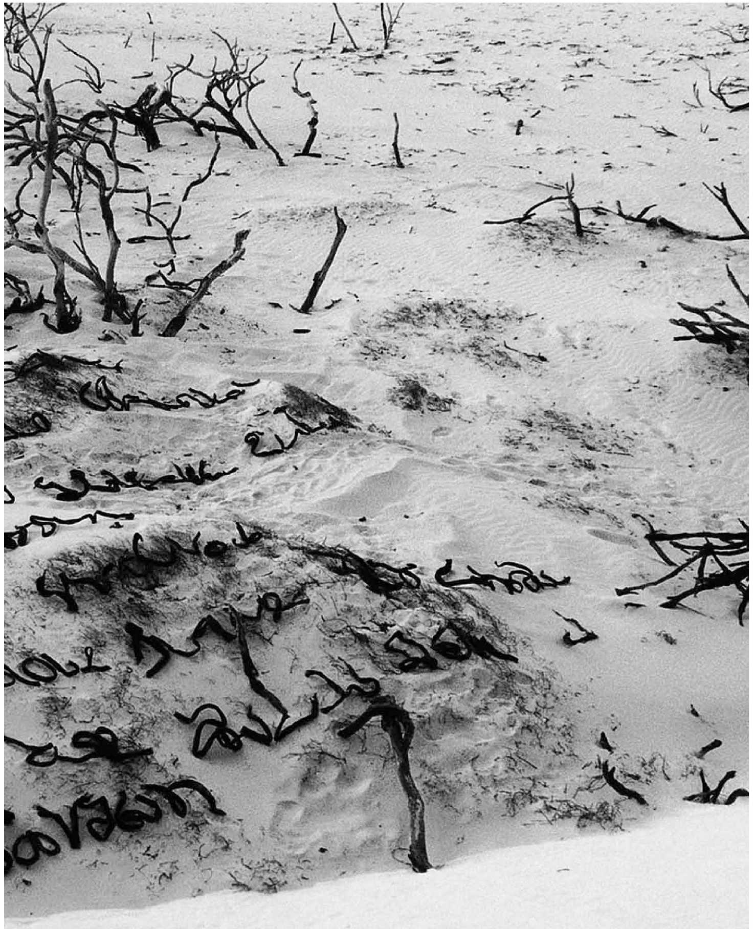
«Postcard», Cape of Good Hope, Sea Bamboo, 2000