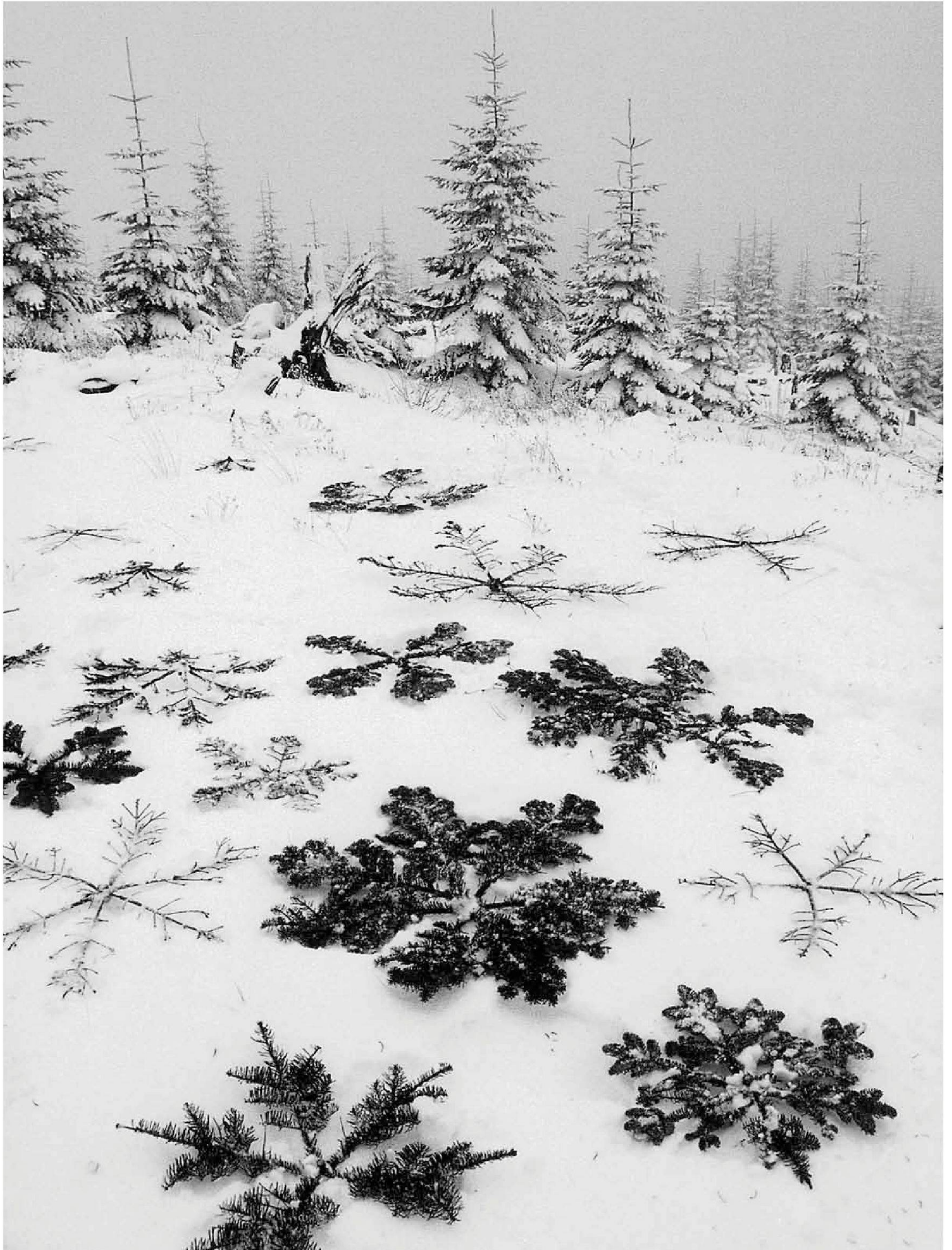
«Noble Fir Crystals», Mt. St. Helens (WA, USA), 2000