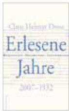
Claus Helmut Drese: «Erlesene Jahre. Begegnungen – Erfahrungen – Inszenierungen. 2007–1932». Berlin: Dittrich, 2008

Das Theater ist in der Krise, heftiger und grundlegender, als man es noch vor zehn Jahren für möglich gehalten hätte. Längst ist sein Anspruch zerronnen in der fortwährenden Verwässerung des Kulturbegriffs, der von der «Unternehmens-» bis hin zur «Szenekultur» keinem, auch noch so marginalen, Lebensbereich vorenthalten wird. Die Mahnung, es handle sich im Theater um den Umgang mit Kunstwerken, gilt als heillos gestrig. Und längst sind die Texte, die in der Regel der Vergangenheit entstammen, zum Freiwild hemmungsloser Regisseure verkommen, denen ihr entgrenztes Assoziationsvermögen als letzte interpretatorische Instanz gilt, bejubelt von einer publizistischen und gesellschaftlichen Schickeria, der es auf den Bühnen nicht «interessant», «provozierend» und «verstörend» genug zugehen kann. Was soll man von einem namhaften Regisseur und Intendanten halten, der zum ersten Tristan-Akt (erste Szenenanweisung: «auf dem Vorderdeck eines Seeschiffes») erklärt, selbstverständlich spiele das bei ihm nicht auf einem Schiff? Wer hier historische Verantwortung anmahnt und derlei unerträgliche Borniertheiten für unzulässig erklärt, gilt heute gemeinhin als jemand, der von den Erfordernissen des gegenwärtigen Theaters eben nichts verstehe.