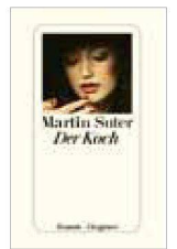
Martin Suter: «Der Koch». Zürich: Diogenes, 2010