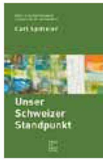
Carl Spitteler: «Unser Schweizer Standpunkt». Hrsg. von Dominik Riedo. Luzern: Pro Libro, 2009

Bedacht jenen Text des Schriftstellers und Literaturnobelpreisträgers in den Vordergrund, der auch heute nichts von seiner Eindringlichkeit verloren hat und zum dauernden Bestand unseres politischen Schrifttums zählt. Es handelt sich um eine von Spitteler im Dezember 1914 gehaltene Rede. Vier Monate zuvor war der Erste Weltkrieg ausgebrochen, und die Auseinandersetzung im Westen hatte nach der Marne-Schlacht den Charakter eines mörderischen Stellungskrieges angenommen. Mit Besorgnis stellte Spitteler fest, dass der deutsch-französische Konflikt in unserem Land zu einer Polarisierung zwischen Deutsch und Welsch geführt hatte, die die Einheit der Nation zu gefährden drohte. In beschwörendem Tonfall wies er auf die staaterhaltende Bedeutung der schweizerischen Neutralität hin und stellte fest, dass der Solidarität zwischen den Schweizer Bürgern der verschiedenen Landesteile die weit wichtigere Bedeutung zukomme als der Parteinahme für eine der sich befehdenden Nationen. Die Rede ruinierte Spittelers Ruf in Deutschland auf Dauer. Es widerfuhr ihm Ähnliches wie dem im Schweizer Exil lebenden französischen Schriftsteller Romain Rolland, dessen Schrift