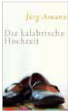
Jürg Amann: «Die kalabrische Hochzeit». Zürich: Arche, 2009

lung des Südtaliens, der für sie aus einer ganz anderen Welt zu kommen scheint. Lorenzo lebt exzessiv und ziellos. Sein Studium der Politikwissenschaften hat er abgebrochen, verdient seinen Lebensunterhalt als Barkellner und Drogenkurier und unterhält ein reges Liebesleben. Für ihn zählt der Genuss im Augenblick, nicht das Versprechen auf eine nahe oder ferne Zukunft. Nach nur vier Monaten trennt Emma sich von Lorenzo und lässt sich noch am selben Tag mit Carlo ein, einem feinfühligem Dichter, von dem sie sich Halt und Sicherheit erhofft. Obwohl sie keinerlei Leidenschaft für ihn empfindet, heiratet sie Carlo, bekommt mit ihm ein Kind und zieht auf seinen Wunsch nach Triest. Allerdings erweist sich der scheinbar so sensible Poet schon bald als selbstverliebter Träumer, der in den Kaffeehäusern der Stadt seinen Weltschmerz kultiviert und mit den banalen Anforderungen des Alltags nicht belästigt werden will.