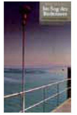
Klaus Isele (Hrsg.): «Im Sog des Bodensees. Eine Anthologie». Eggingen: Edition Isele, 2009