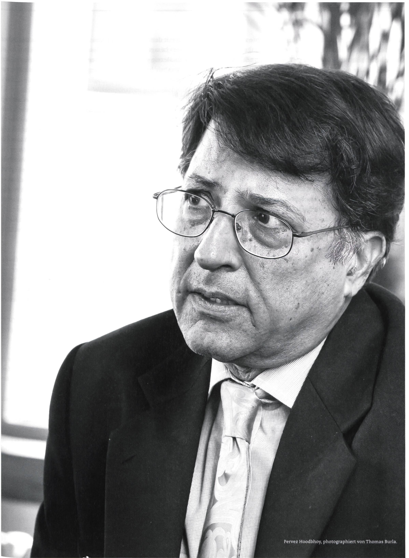
Pervez Hoodbhoy