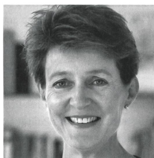
Simonetta Sommaruga Bundesrätin, Vorsteherin des Eidg. Justiz- und Polizeidepartements EJPD

Dienstag, 24. April 2012 09.00 bis 18.00 Uhr