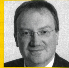
Lars P. Feld

Senior research fellow, The Centre for European Reform, London