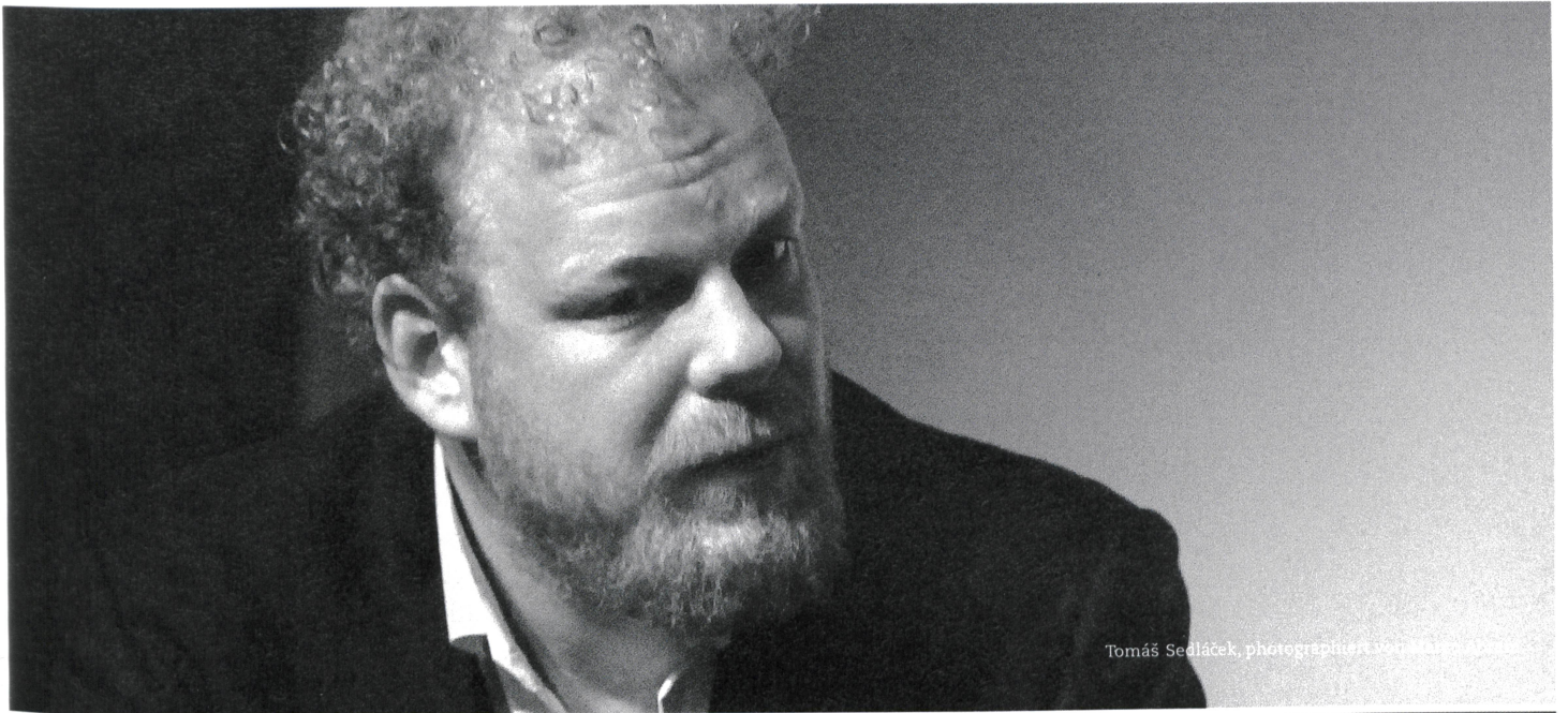
Tomáš Sedláček