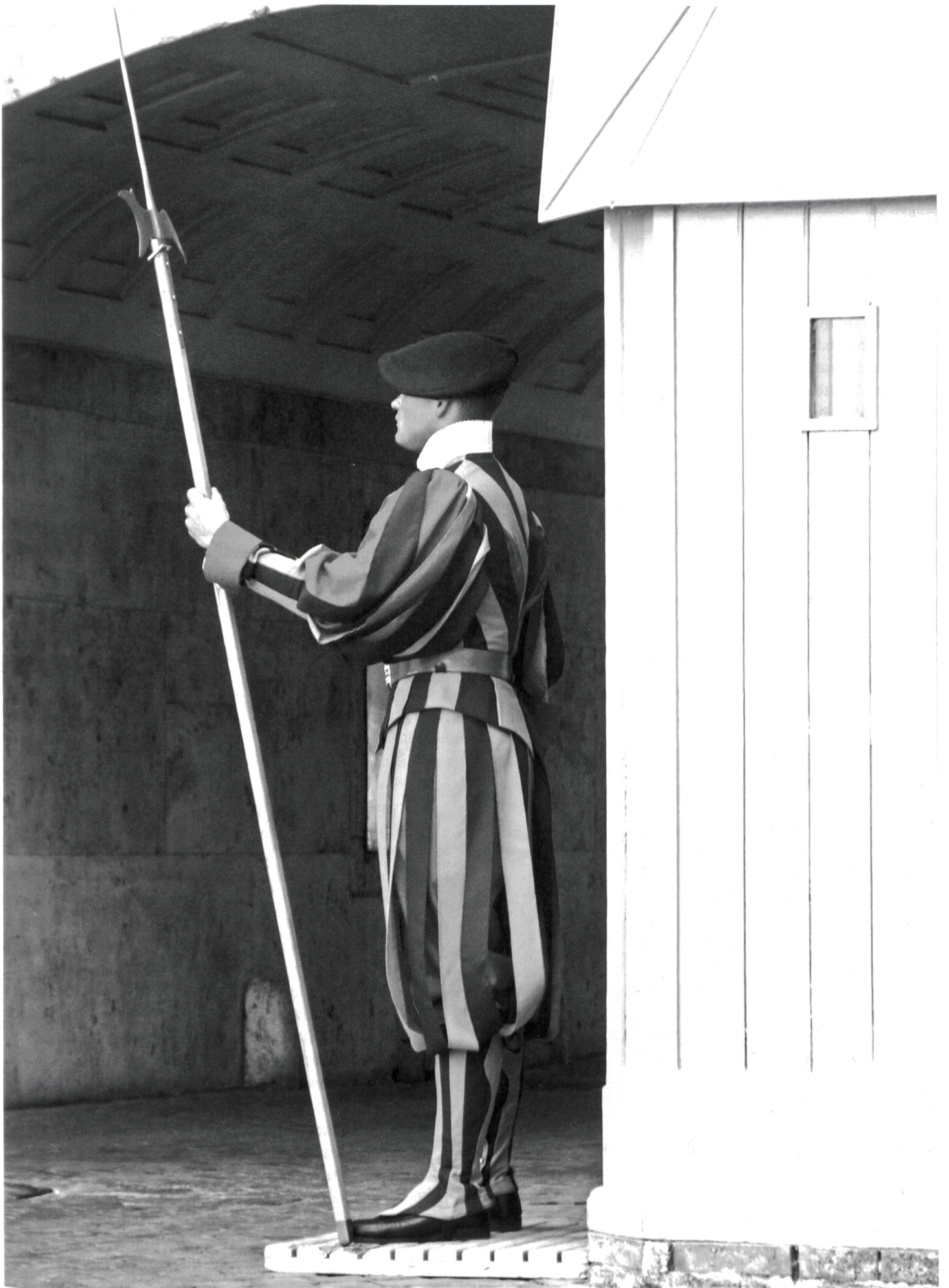
Bald zurück an die Schweizer Grenze?