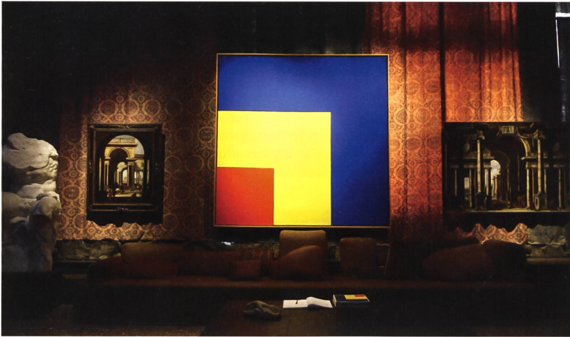
Niccolo Codazzi, Ellsworth Kelly, Viviano Codazzi. Palazzo Fortuny: Proportio (2015)