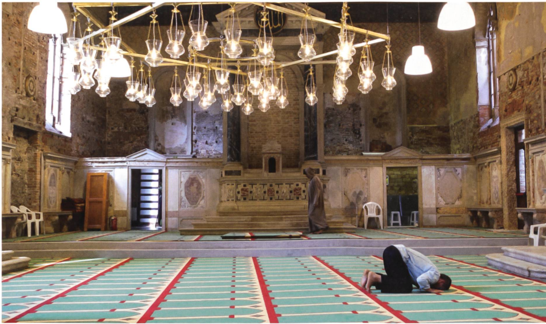
Christoph Büchel: The Mosque (2015)