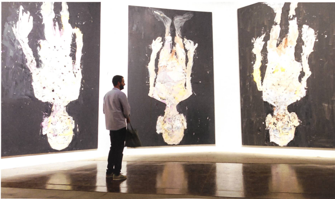
Altmeister Georg Baselitz steht immer noch kopf: Fällt von der Wand nicht (2014), acht rund 5 Meter hohe Selbstportraits.