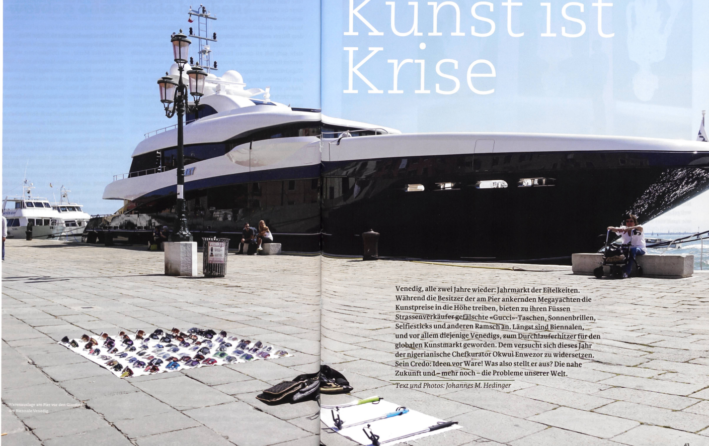
Warenauslage am Pier vor den Quarenghi bei Biennale Venedig

Venedig, alle zwei Jahre wieder: Jahrmart der Eitelkeiten. Während die Besitzer der am Pier ankernden Megayachten die Kunstpreise in die Höhe treiben, bieten zu ihren Füßen Strassenverkäufer gefälschte «Gucci»-Taschen, Sonnenbrillen, Selfiesticks und anderen Ramsch an. Längst sind Biennalen, und vor allem diejenige Venedigs, zum Durchlauferhitzer für den globalen Kunstmarkt geworden. Dem versucht sich dieses Jahr der nigerianische Chefkurator Okwui Enwezor zu widersetzen. Sein Credo: Ideen vor Ware! Was also stellt er aus? Die nahe Zukunft und – mehr noch – die Probleme unserer Welt.