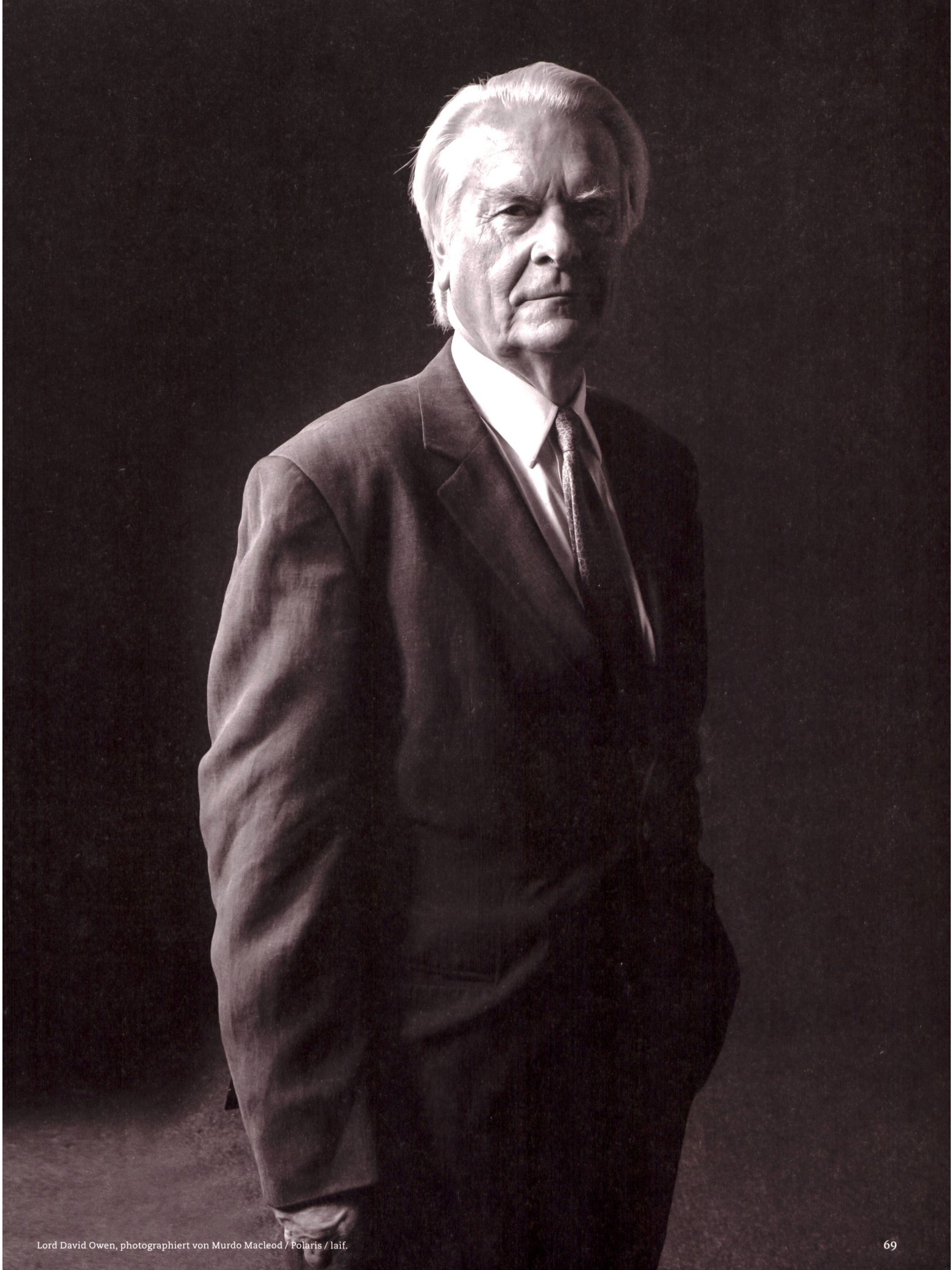
Lord David Owen