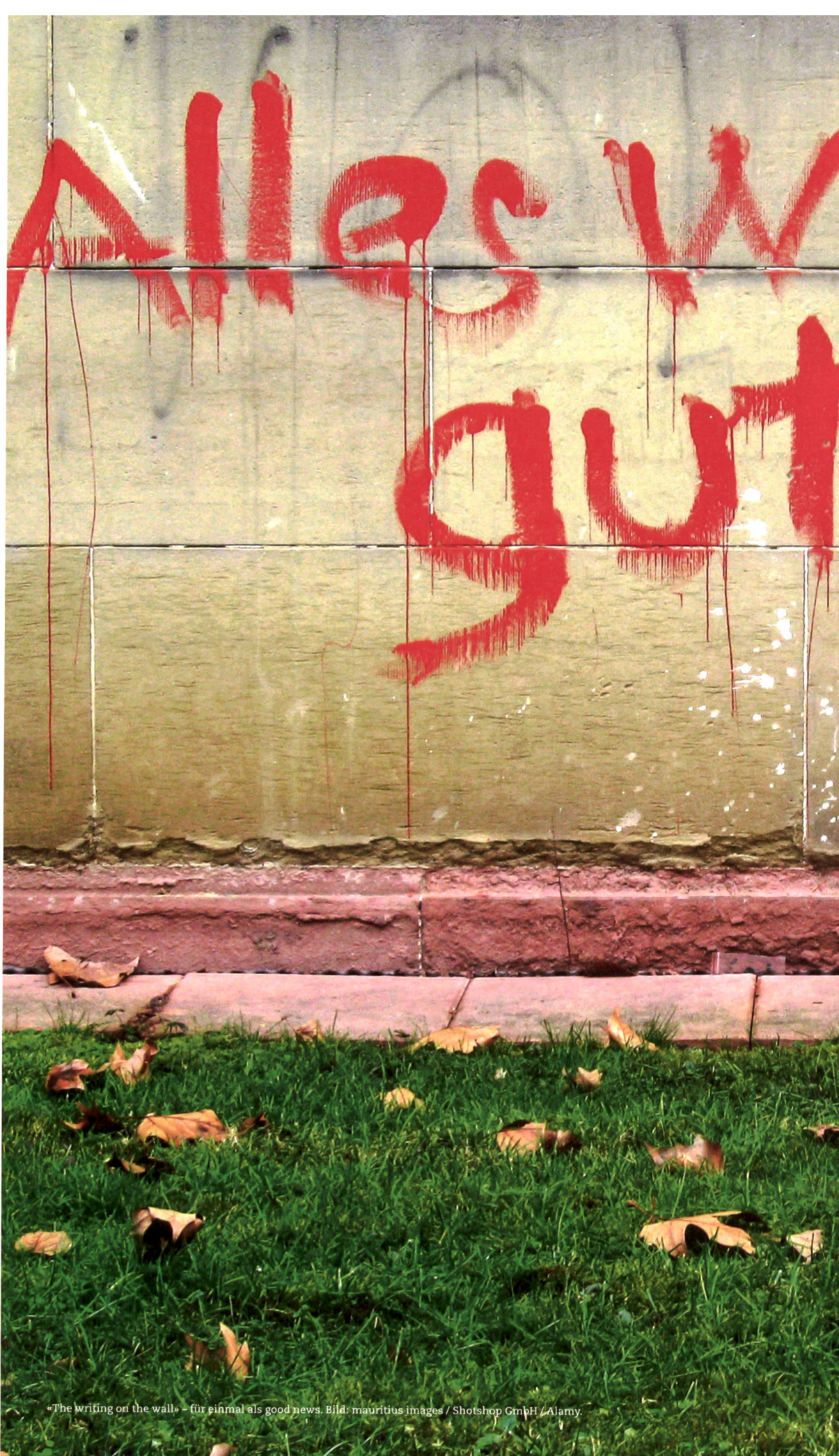
«The writing on the wall» - für einmal als good news.