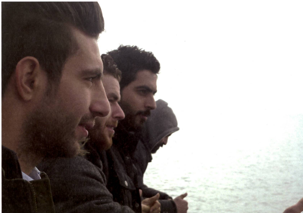
Syrer aus Aleppo, Damaskus und Qamishli auf dem Vierwaldstättersee, unterwegs zum Rütli, Dezember 2015.