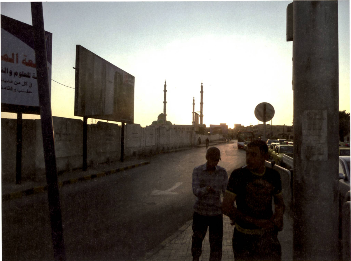
Ausfallstrasse in Aleppo, Stadtteil Al Masharika, 2009.