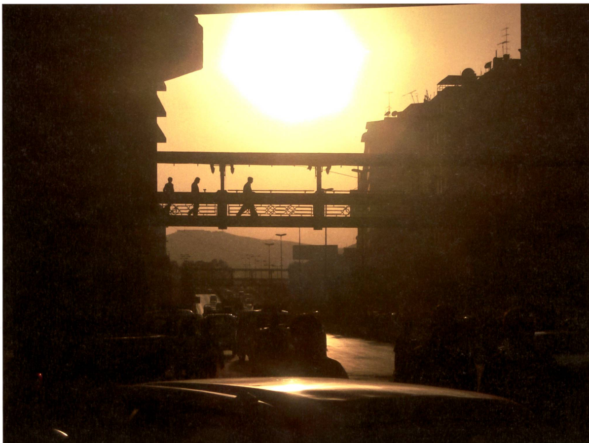
Fussgängerbrücke Shoukry al-Qouwatly (Strasse der Revolution), Damaskus, 2010.