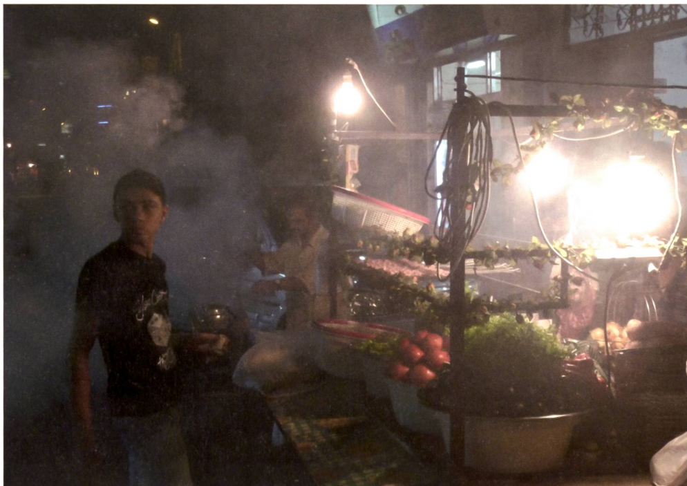
Kebab-Stände im Zentrum von Aleppo, nach dem Fastenbrechen, 2007.