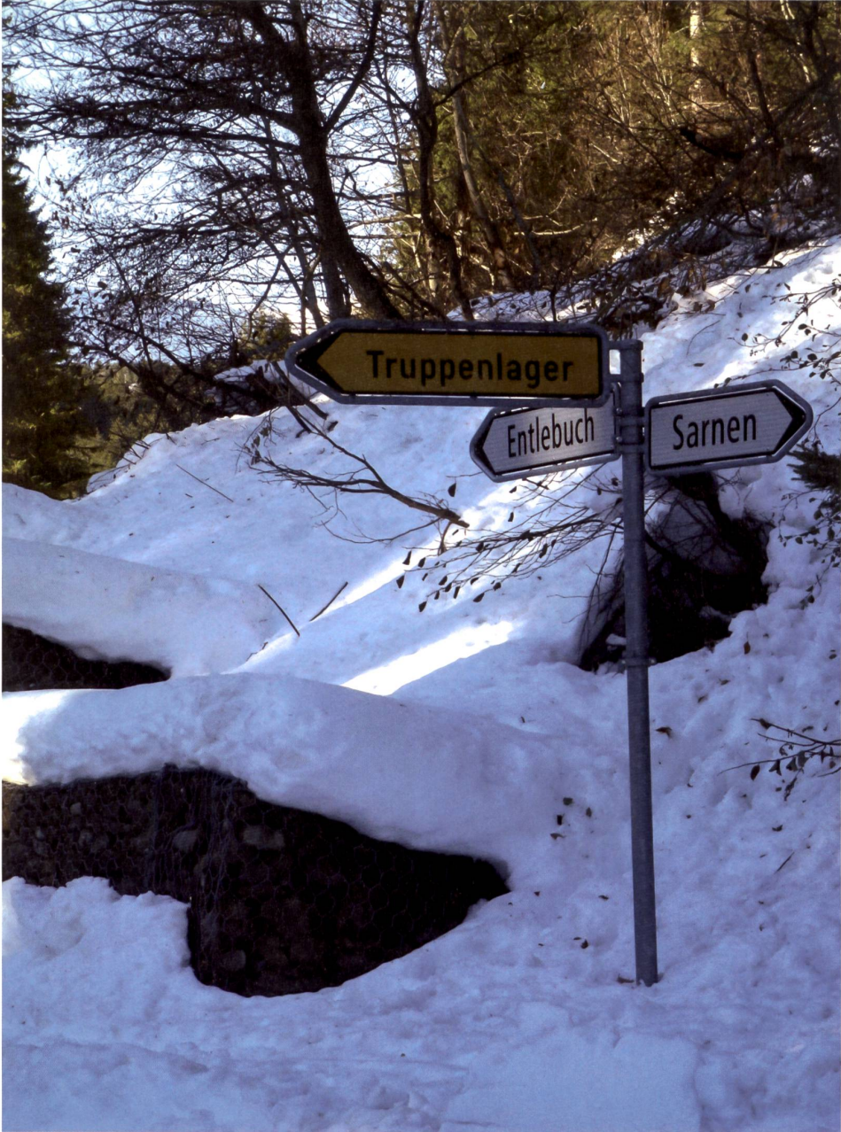
Eingang zum Truppenlager Glaubenberg (OW), heute Durchgangslager für Asylbewerber, Dezember 2015.