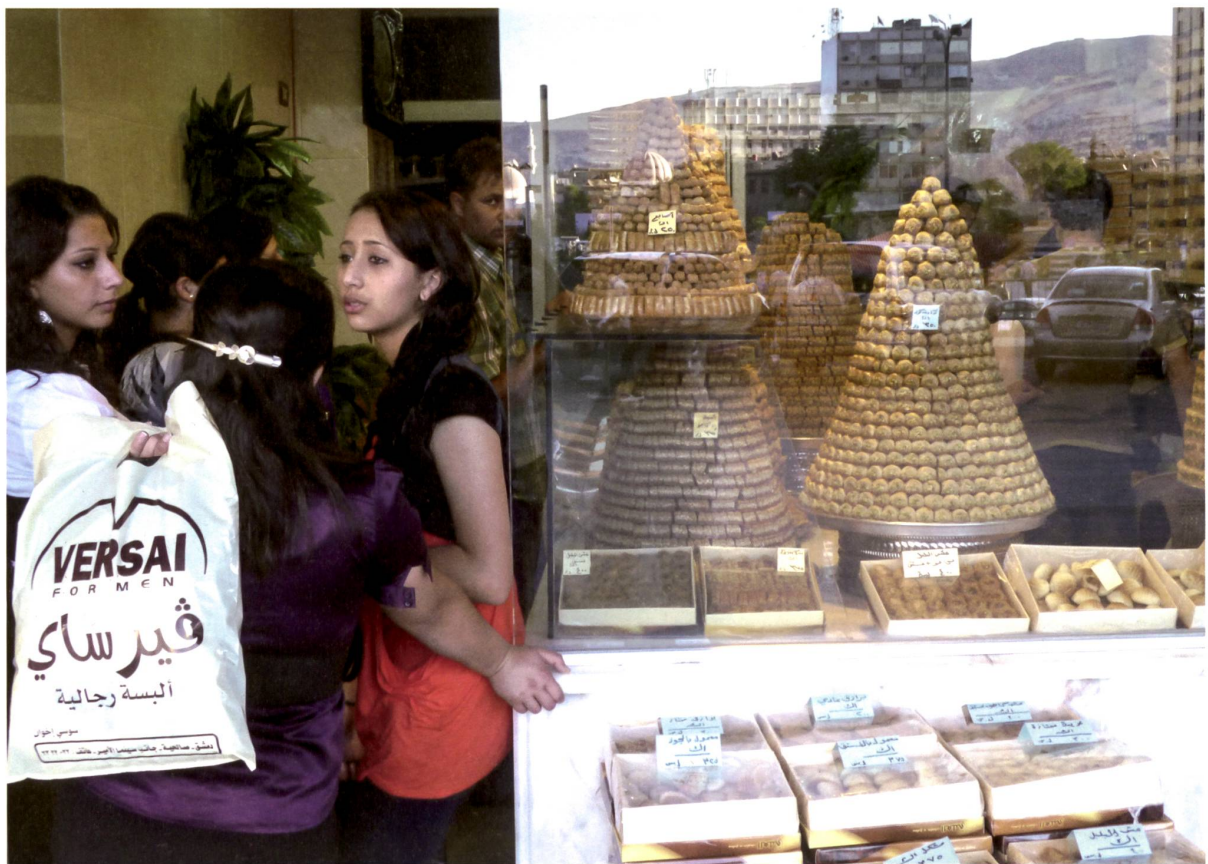
Konditorei am Al-Marjeh Square im Zentrum von Damaskus, 2010.