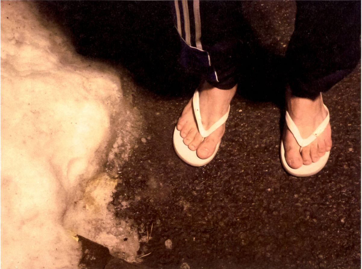
Syrer im Durchgangslager auf dem Glaubenberg-Pass (OW), zuvor Truppenunterkunft, Dezember 2015.