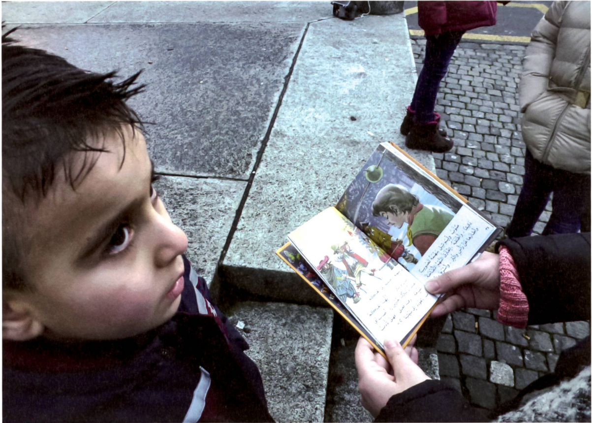
Palästinensischer Junge aus Syrien mit Tell-Büchlein in Arabisch, Altdorf, 2015.