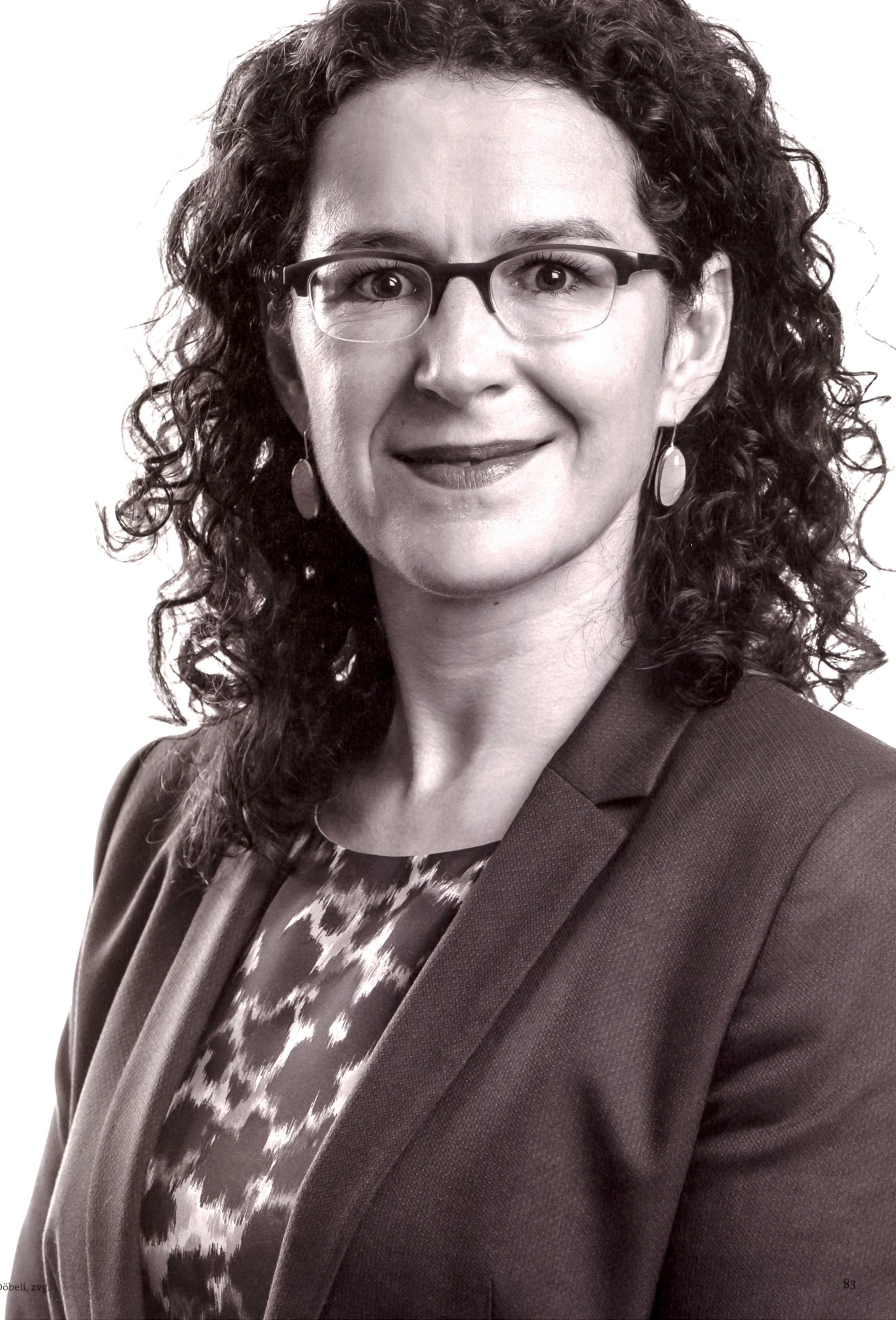
Sabine Döbeli, zvg