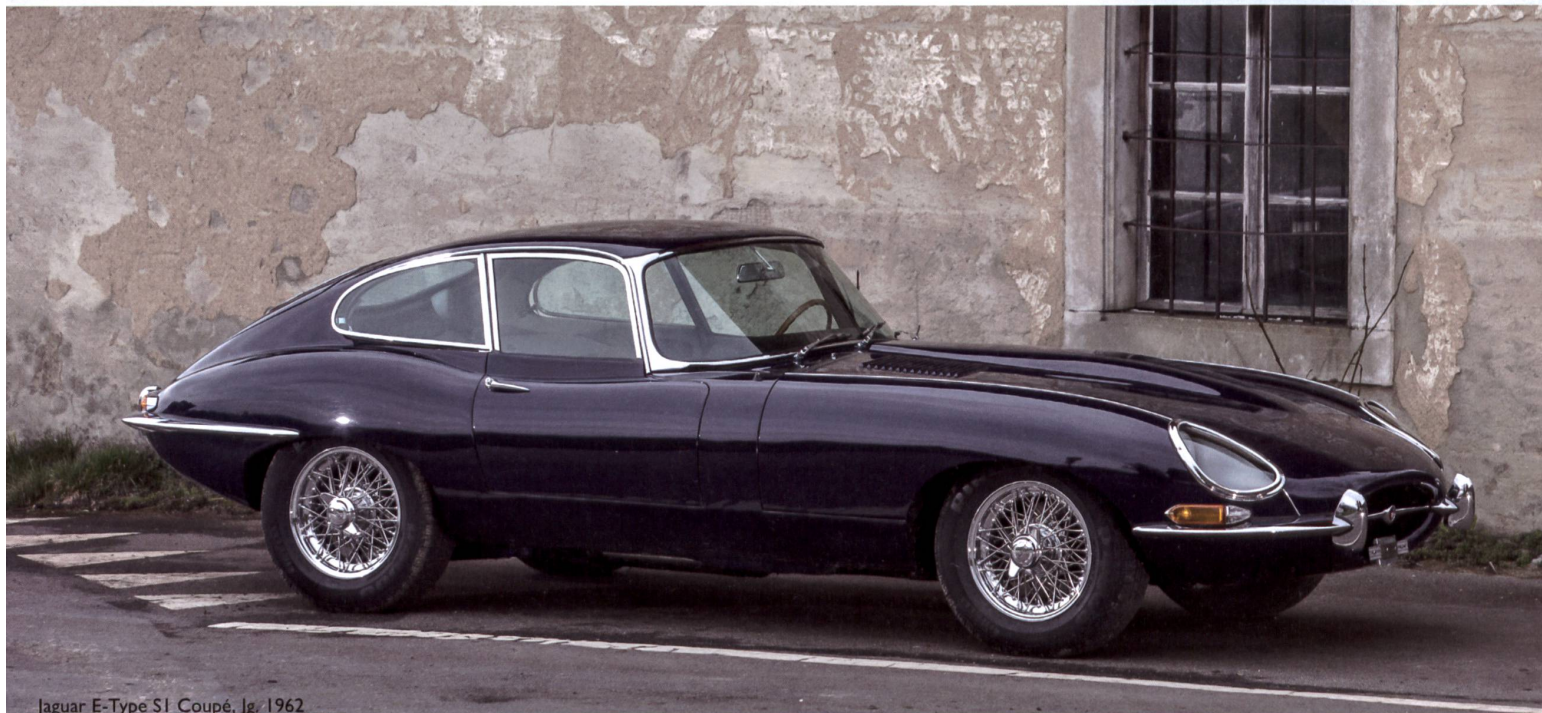
Jaguar E-Type S1 Coupé, Jg. 1962