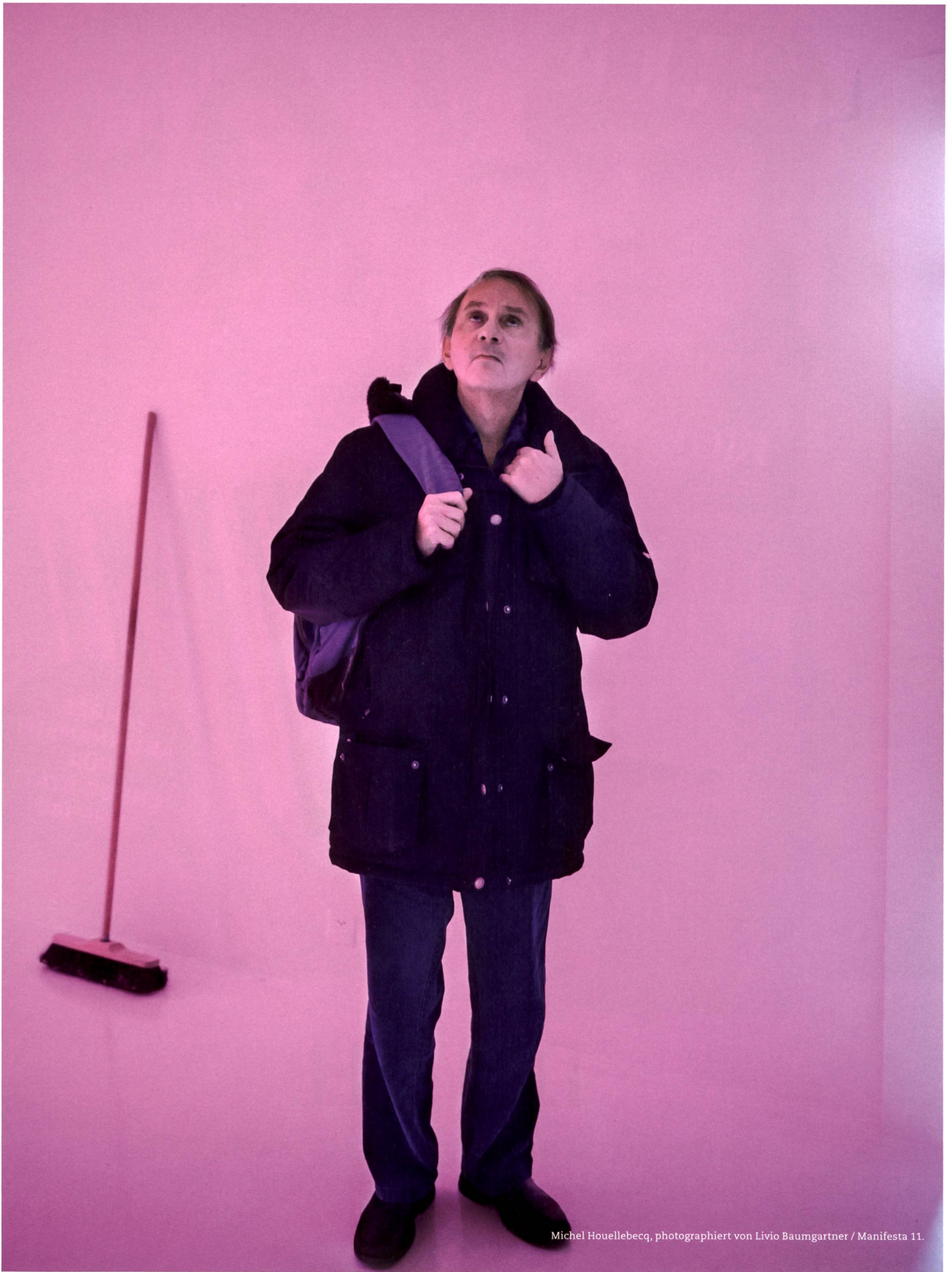
Michel Houellebecq