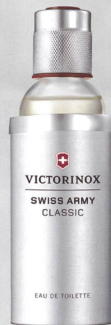
SWISS ARMY CLASSIC