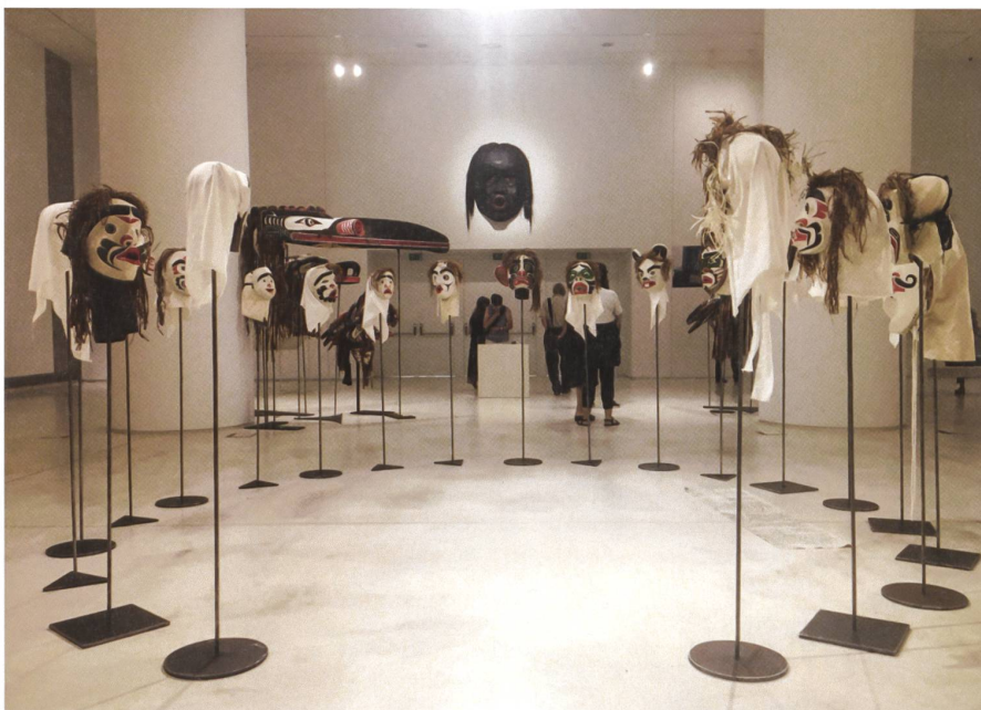
Masken von Beau Dick (Kanada) aus der Serie «Undersea Kingdom» (2016/17) im EMST in Athen.