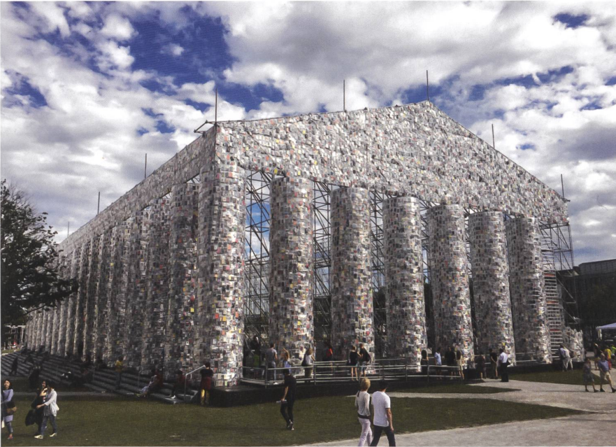
«Parthenon of Books» (2017) von Marta Minujín (Argentinien) auf dem Friedrichsplatz in Kassel, behängt mit einst oder immer noch verbotenen Büchern.