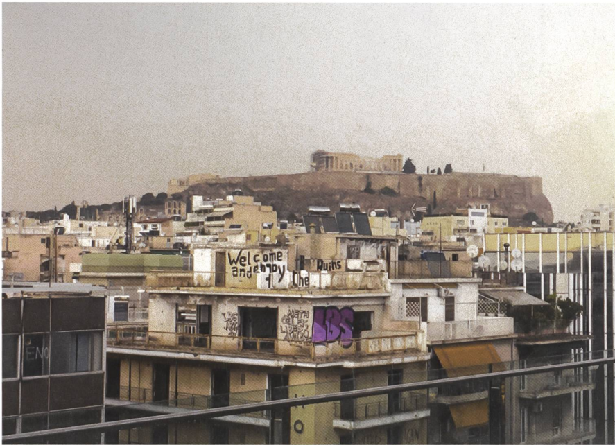
Blick vom obersten Stock des Museums für zeitgenössische Kunst (EMST) in Athen: Graffito «Welcome and enjoy the ruins» (unbekannt).