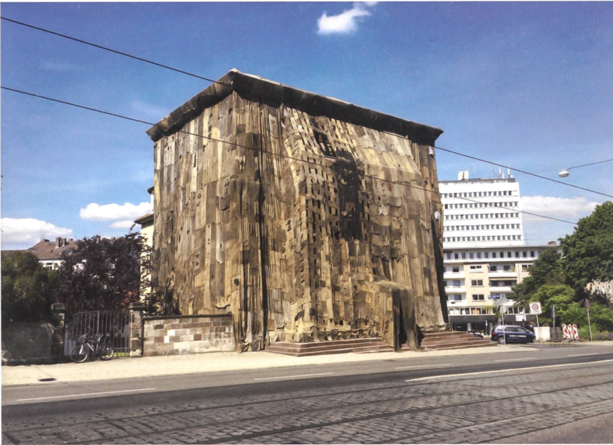
«Check Point Sekondi Loco 1901–2030. 2016–2017» (2016/17) von Ibrahim Mahama (Ghana) – mit Kohlen- säcken verhängte Torwache in Kassel.