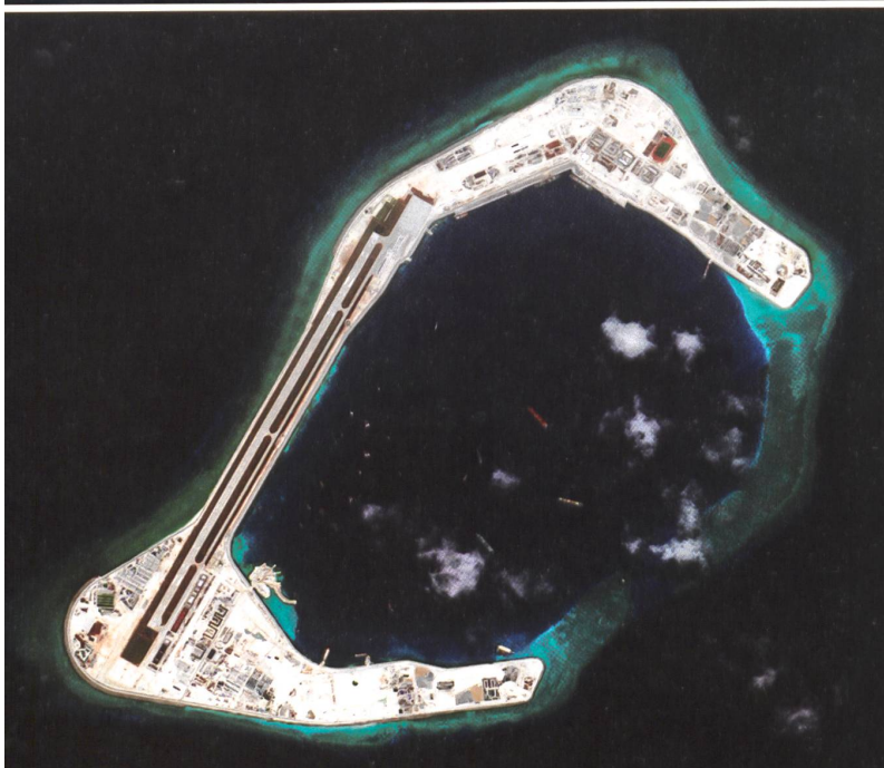
Die Republik China, Vietnam, die Volksrepublik China, Brunei, Malaysia und die Philippinen – sie alle erheben (Teil-)Ansprüche auf die Spratly Islands im Südchinesischen Meer. Viele davon schaffen seit 2013 kontinuierlich Tatsachen durch Aufschütten von Riffen zu Inseln. Hier in Satellitenbildern: das Subi Reef in der Zeitspanne 2012 bis 2016, geformt von der Volksrepublik China.