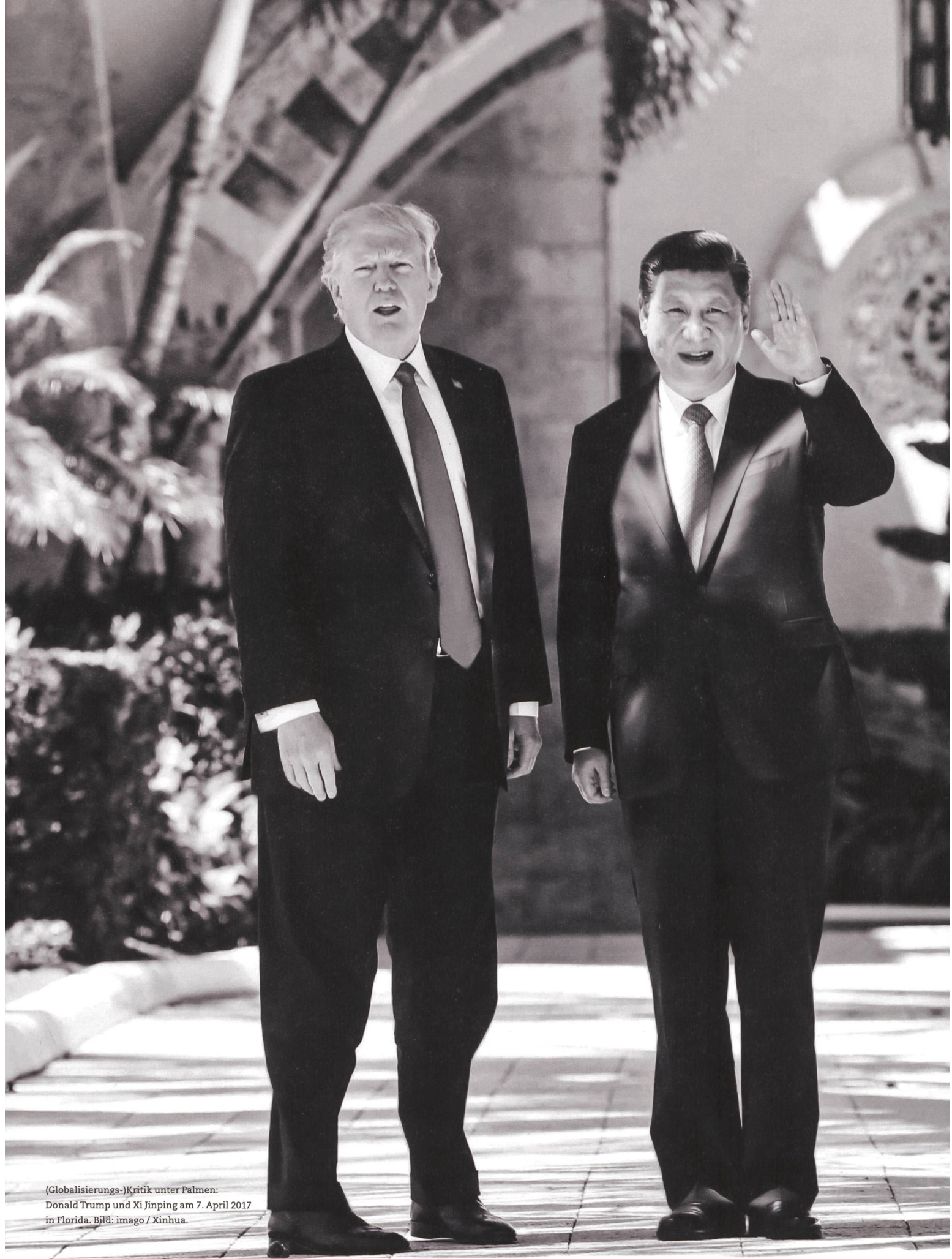
(Globalisierungs-)Kritik unter Palmen: Donald Trump und Xi Jinping am 7. April 2017 in Florida.