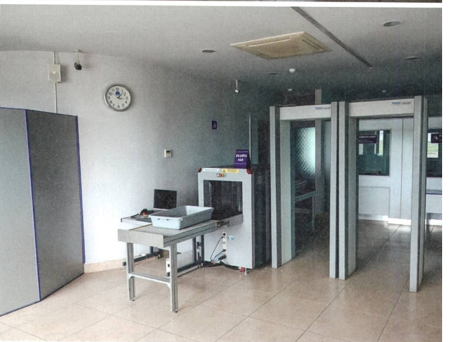
Der leere Flughafen von Stepanakert.